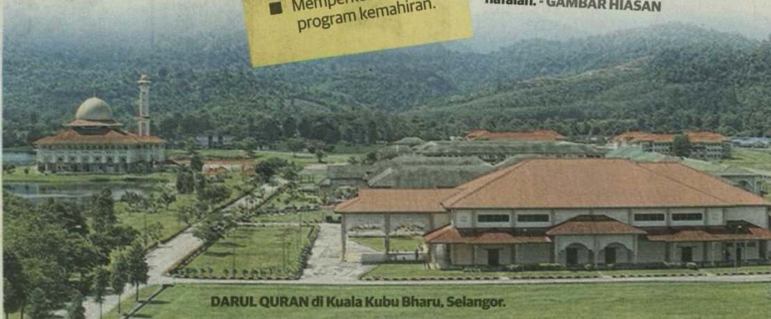
DARUL QURAN di Kuala Kubu Bharu, Selangor.