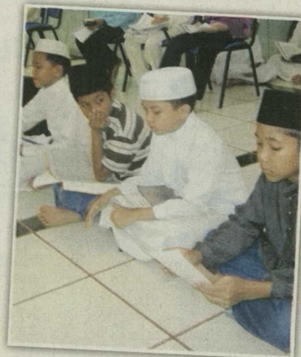
MEMBACA al-Quran beramai-ramai antara kaedah yang digunakan untuk hafalan. - GAMBAR HIASAN