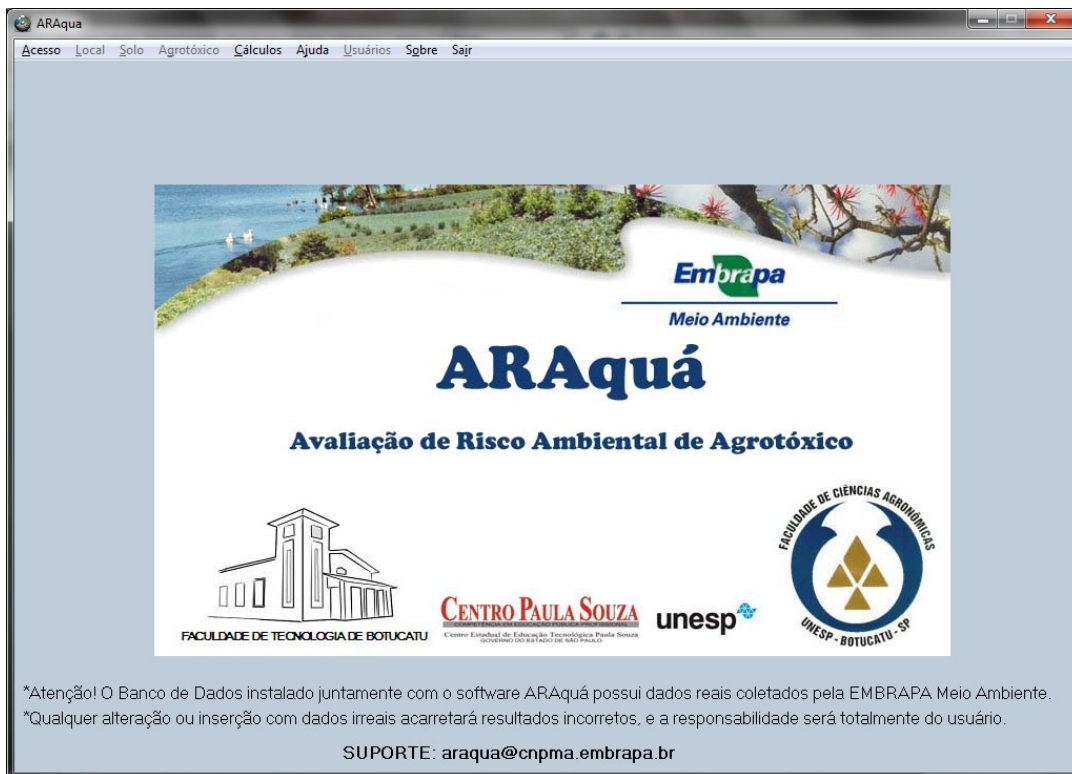
Figura 1. Tela inicial do ARAquá.