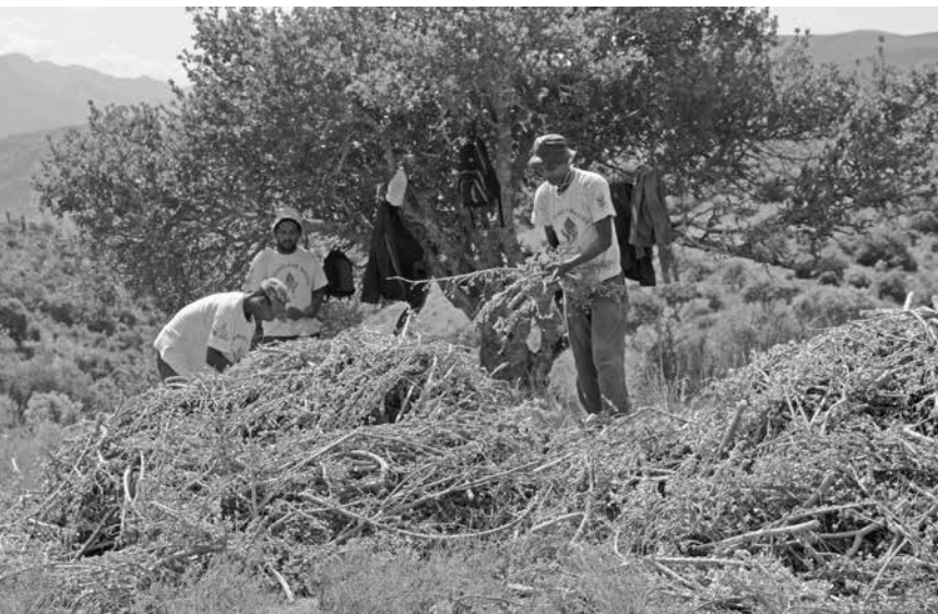
Im Programm Working for Water wird in der Baviaanskloof (Ostkap) im grossen Stil der heimische Spekboom angepflanzt (Bild: James Merron 2012).

Eine ökologische Wirtschaft, die sogenannte «Green Economy», scheint für viele Beteiligte ein Zaubermittel für die Lösung einer Vielzahl globaler Probleme zu sein, sei es die Bekämpfung des Klimawandels durch Pflanzen oder die Schaffung von Frieden und Wohlstand über den Schutz von Elefanten und Nilpferden. Das dabei oft angeführte Argument, man müsse Natur verkaufen um sie zu schützen, liefert jedoch auch einen guten Vorwand, bisher allgemeine Güter in ein kapitalistisches System einzufügen und dabei neue Räume für Kapitalgewinn zu erschliessen. Vor diesem Hintergrund erscheint es umso überraschender, dass gerade auch viele Nichtregierungsorganisationen und Non-Profit Organisationen in der Vermarktung von Natur eine «globale Lösung» sehen. Zwei Beispiele sollen im Folgenden kurz vorgestellt werden.