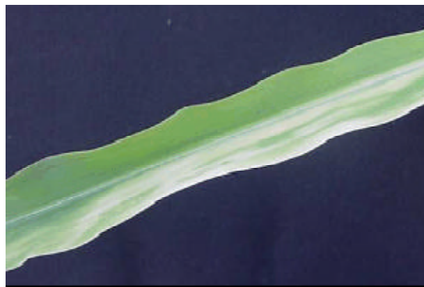
Figura 2. Sintomas de fitotoxicidade de mesotrione na folha de milho.

o herbicida, produzindo metabólitos sem atividade tóxica. A absorção do herbicida ocorre tanto nas raízes quanto nas folhas e ramos (Syngenta, 2004; MAPA, 2004). Este herbicida apresenta baixa toxicidade, com pequeno risco para os mamíferos, pássaros, ambiente e espécies aquáticas. (O'Sullivan, 2002).