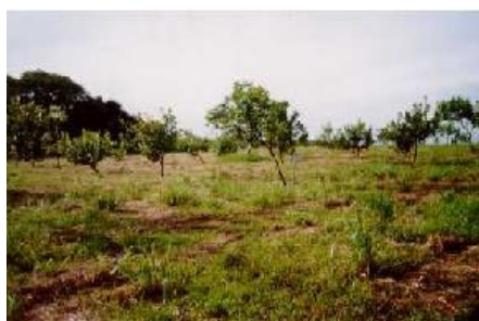
Fig. 7. Plantas apresentando estiolamento antes da poda, clone CCP 1001.

• Clone de cajueiro-anão CCP 1001 - Originário da matriz CP 1001, apresenta pedúnculo vermelho e grande variação do peso do fruto dentro de cada planta. No ambiente amazônico, durante o período chuvoso, apareceram manchas acinzentadas nas folhas velhas, as quais desapareceram completamente no período seco. Algumas plantas da unidade experimental apresentaram estiolamento, que foi devidamente controlado com poda de formação de copa (Fig. 7). Esta é uma característica indesejável em pomares comerciais, uma vez que na seleção de clones, a prioridade é para plantas de porte baixo, de modo que, pelo maior adensamento, sejam possíveis altas produtividades com menor tamanho de copa (Barros et al., 2000). Observou-se ausência total de pragas e de doenças tais como, antracnose. A exemplo do clone CCP 76, o início da fase reprodutiva, deu-se também, aos dezenove meses de idade, em julho de 2001. Esse clone está apresentando, atualmente, excelente aspecto fitossanitário e vegetativo (Fig. 8).