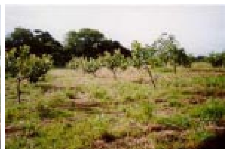
Fig. 8. Vista geral da área cultivada com cajueiro-anão precoce, clone CCP 1001.

• Clone de cajueiro-anão Embrapa 50 – É um híbrido proveniente dos genótipos CP 06 (anão precoce) e o CP 07 (comum) (Barros et al., 2002). Apresenta coloração amarela. No ambiente amazônico, verificou-se nesse clone, ausência total de pragas, de antracnose e, raro aparecimento de mofo-preto. O início da fase reprodutiva ocorreu aos 20 meses de idade, em agosto de 2001. Esse clone se destacou dos demais pela conformidade e aspecto de copa densa (Fig. 9), compacta e arredondada, em forma de guarda-chuva. Características semelhantes foram identificadas por Barros et al. (2000), em seleção de clones de cajueiro-anão para plantio comercial no Estado do Ceará.