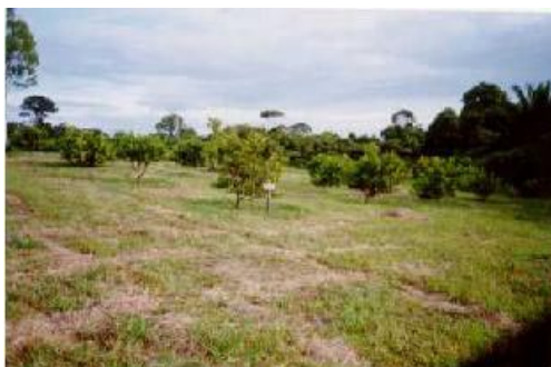
Fig. 4. Vista geral do pomar de cajueiro-anão precoce, clone CCP 09. Carauari, AM.

Quanto ao aspecto vegetativo, foi mais desenvolvido que o do clone CCP 06, com exceção de 5% das plantas que tiveram o crescimento afetado pela má drenagem do terreno (Fig. 4). Foi o mais precoce dos clones, iniciando a fase produtiva aos dezesseis meses de idade, em maio de 2001.