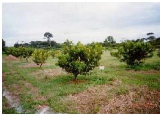
Fig. 3. Vista geral do clone CCP 06 com floração fora de época. Carauari, AM.

• Clone de cajueiro-anão CCP 06 – Selecionado em 1979, a partir da matriz CP 06, avaliado durante 15 anos no Campo Experimental de Pacajus, da Embrapa Agroindústria Tropical, em Pacajus, CE. O pedúnculo é de coloração amarela e a maior produção registrada na planta matriz foi 25 kg de castanha, em solo arenoso do litoral, de baixa fertilidade, sem correção e fertilização nem controle de pragas (Barros et al., 2002). No ambiente amazônico, aos dez meses de idade, observou-se estagnação do crescimento de 10% das plantas, as localizadas na parte da área onde ocorre encharcamento. Nessas plantas os ramos novos apresentaram-se entumecidos e as folhas com aspecto coriácio. Efetuou-se, então, uma poda dos ramos afetados, seguida de uma pulverização com oxiclreto de cobre. Observou-se, então, através da escala de severidade de ataque adotada, que esse clone comportou-se, em relação aos demais, de modo semelhante ao verificado por Cardoso et al. (1997) no Litoral nordestino, quanto à reação à antracnose e ao mofo-preto. As plantas apresentaram melhor resposta ao ataque dessas fitomoléstias, tanto no período chuvoso quanto na estação seca, que vai de junho a outubro. O início da fase de floração ocorreu em junho de 2001, aos dezoito meses (Fig. 3).