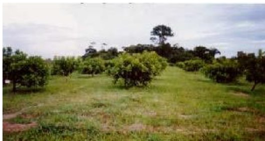
Fig. 9. Vista parcial do clone Embrapa 50, destacando-se a boa formação da copa. Carauari, AM.

• Clone de cajueiro-anão Embrapa 51 – Foi obtido por meio da seleção dentro de uma progênie policruzada, seguida de avaliação clonal, na Região Litorânea no Estado do Ceará (Barros et al., 2000). Durante o primeiro ano de avaliação no ambiente amazônico, apresentou raríssima incidência de mofo-preto e de antracnose e, também, ausência total de pragas. Cerca de 5% das plantas apresentaram “estiolamento” que foi corrigido com poda de formação de copa (Fig. 10). Algumas plantas desse clone tiveram sua altura contrastada com a do cajueiro-anão precoce, caracterizada por um crescimento acima de quatro metros de altura e sempre ascendente. Na opinião de Barros et al. (2000), planta de porte baixo é um caráter da maior importância em frutíferas perenes. Clones de cajueiro possuem esse caráter, que facilita as práticas de manejo, como poda e combate de pragas e doenças, de difícil execução ou inviáveis em pomares de cajueiro do tipo comum.