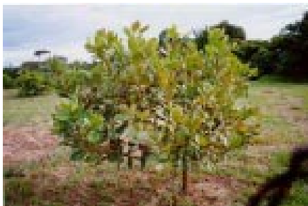
Fig. 6. Planta do clone CCP 76 com folhas afetadas com mofo-preto. Carauari, AM.