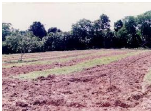
Fig. 1. Solo com cobertura vegetal de floresta tropical densa. Carauari, AM.

O solo da área experimental é classificado como Podzólico Vermelho-Amarelo Álico, textura média, tendo como material originário, sedimentos da formação Solimões, Plio-Pleistoceno. Local em relevo plano com declividade de 0-5%, bem drenado e cobertura vegetal com floresta tropical densa (Fig. 1).