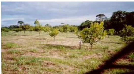
Fig. 10. Vista do pomar de cajueiro-anão precoce, clone Embrapa 51. Carauari, AM.

• Clone de cajueiro-anão Embrapa 51 – Foi obtido por meio da seleção dentro de uma progênie policruzada, seguida de avaliação clonal, na Região Litorânea no Estado do Ceará (Barros et al., 2000). Durante o primeiro ano de avaliação no ambiente amazônico, apresentou raríssima incidência de mofo-preto e de antracnose e, também, ausência total de pragas. Cerca de 5% das plantas apresentaram “estiolamento” que foi corrigido com poda de formação de copa (Fig. 10). Algumas plantas desse clone tiveram sua altura contrastada com a do cajueiro-anão precoce, caracterizada por um crescimento acima de quatro metros de altura e sempre ascendente. Na opinião de Barros et al. (2000), planta de porte baixo é um caráter da maior importância em frutíferas perenes. Clones de cajueiro possuem esse caráter, que facilita as práticas de manejo, como poda e combate de pragas e doenças, de difícil execução ou inviáveis em pomares de cajueiro do tipo comum.