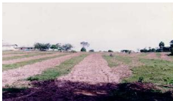
Fig. 2. Preparo do solo em curvas de nível e gradagem em faixas alternadas. Carauari, AM.

O preparo da área experimental limitou-se a uma gradagem pesada (com grade de arrasto) em faixas alternadas, e curvas de níveis em virtude da declividade do terreno exceder a 3% (Fig. 2). Em seguida, fez-se a distribuição manual do calcário dolomítico (3,0 t/ha) e posterior incorporação com grade leve a 30 cm de profundidade.