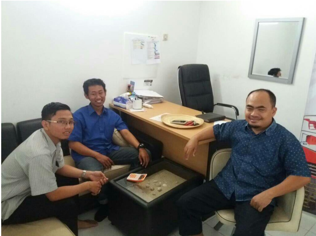
Gambar 3 saat bersama Direktur CV. Rumah Mesin