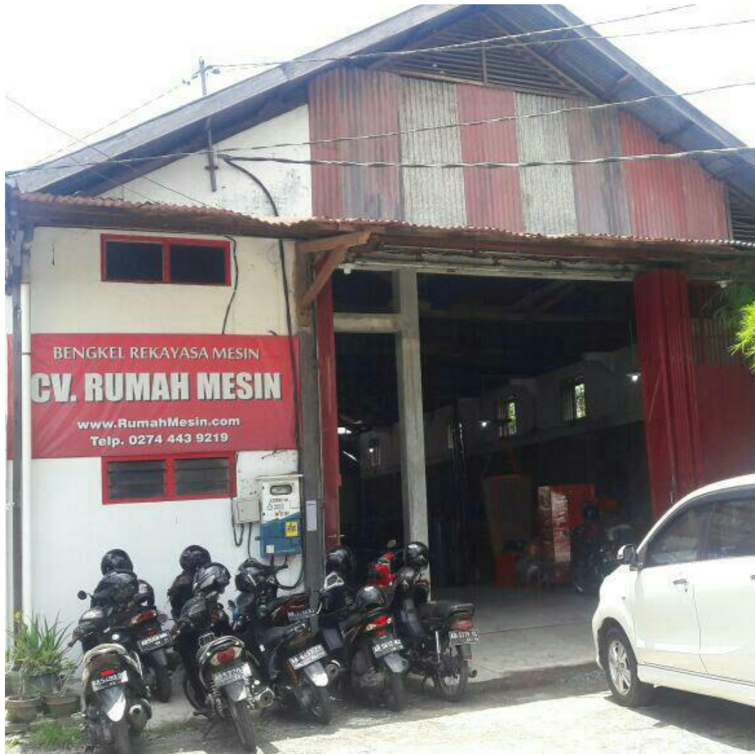
Gambar 1 Halaman depan CV. Rumah Mesin