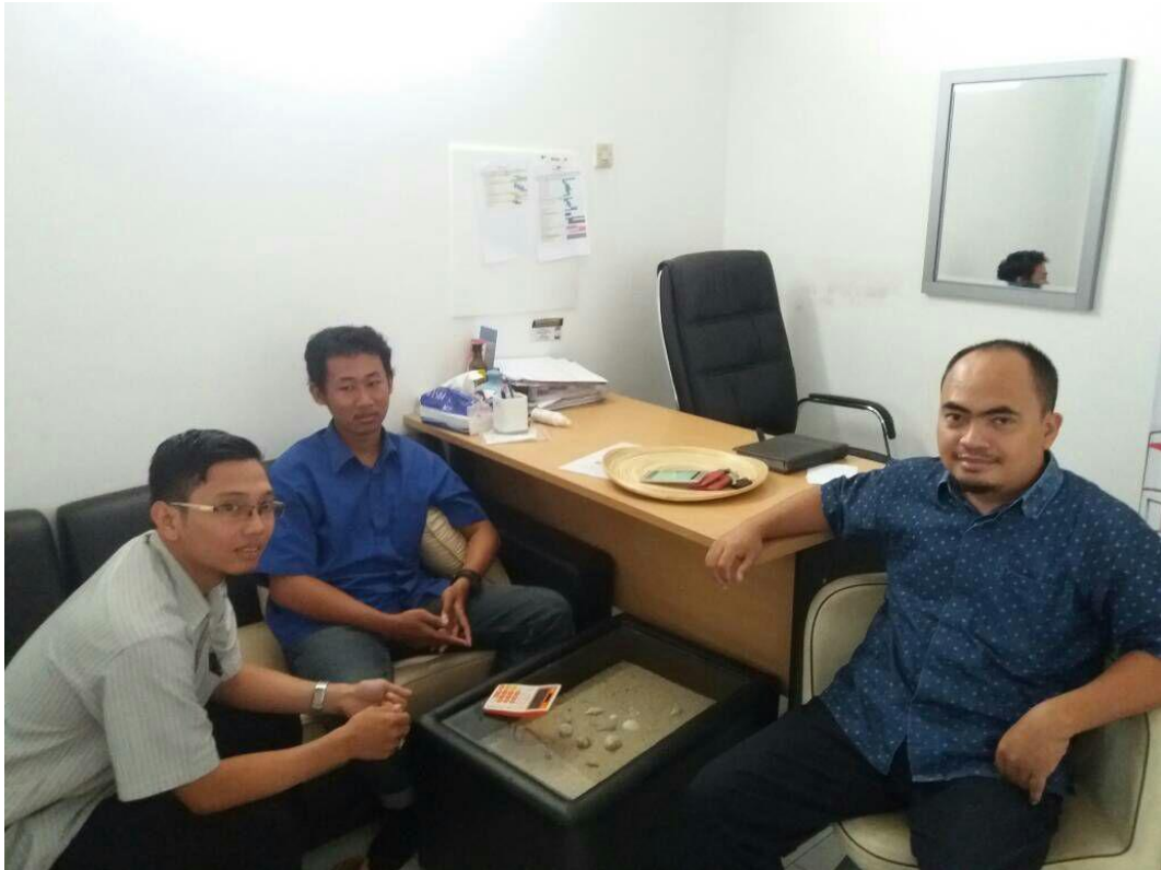
Gambar 4 Dokumentasi dengan Direktur