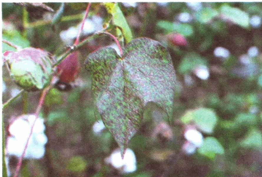
FIGURA 7. Manchas de Alternaria

qual parece estar associada também a solos mal corrigidos na região do Cerrado (Figura 7).