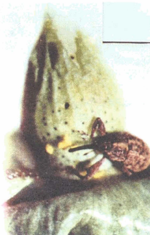
FIGURA 10. Bicudo e botão com sintomas de ataque

cor branco-amarelado, esféricos, com 0,5mm de diâmetro, sendo as larvas do bicudo de coloração branco a creme; as larvas, que eclodem com aproximadamente 1mm, completam seu ciclo no interior das estruturas frutíferas (botões e maçãs) e em seguida emergem os adultos (Figura 10).