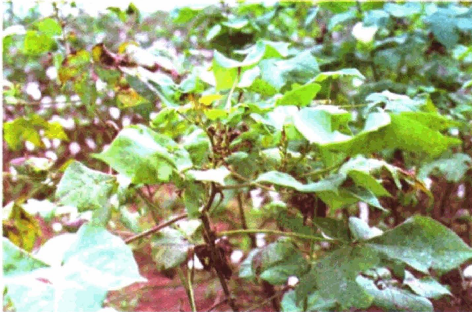
FIGURA 3. Sintomas típicos de ramulose tardia em algodoeiro

constituir furos nos limbos foliares; há redução dos internódios perto do ponteiro, manchas necrosadas no caule e hastes, superbrotamento dos ponteiros e, finalmente, redução acentuada do porte das plantas devido à paralisação do crescimento (Figura 3).