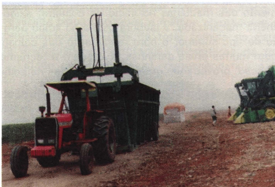
FIGURA 12. Equipamento para formação de fardão e armazenamento na lavoura

Na hipótese das plantas terem ficado com alturas muito baixas, devido a veranico, recomenda-se efetuar a colheita do baixeiro manualmente, para evitar desperdício na colheita mecânica, por não sucção desses capulhos. O algodão colhido mecanicamente é transportado, em geral, em gaiolas para as usinas de descaroçamento, onde é beneficiado ou empacotado em fardões ou módulos que ficam armazenados nos carreadores, para posterior transporte até as algodozeiras, através de transmódulos, que são caminhões especialmente adaptados para o carregamento, transporte e descarregamento dos módulos. Assim, como a lavoura necessita de adaptações para uso da colheita mecanizada, também as algodozeiras devem possuir pátios de armazenamento de gaiolas ou módulos e pré-limpadores de algodão em caroço (Figura 12).