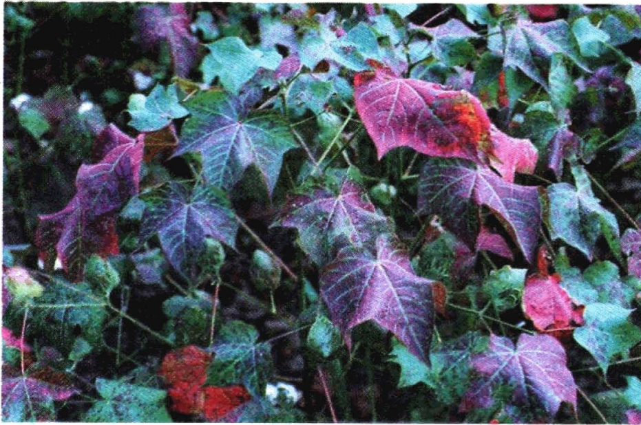
FIGURA 4. Vermelhão em algodoeiro

O vírus do vermelhão é transmitido pelo pulgão, que o dissemina a partir de plantas infectadas; existem outras causas de avermelhamento das folhas, que devem ser pesquisadas antes de se concluir pelo vermelhão, entre as quais o avermelhamento causado por fungos do tombamento, broca, insetos, queimaduras