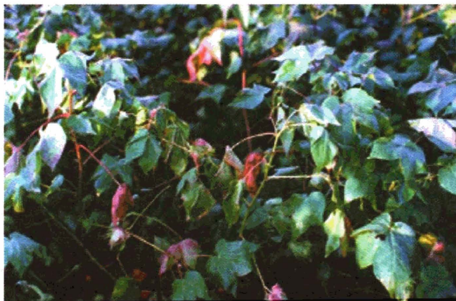
FIGURA 9. Planta com sintomas de Murchamento Avermelhado

com o murchamento e amarelecimento das plantas, seguido de avermelhamento e morte, em alguns casos; em outros casos, ocorre a recuperação da planta. As folhas ficam com o aspecto de "cara de cachorro" (Figura 9).