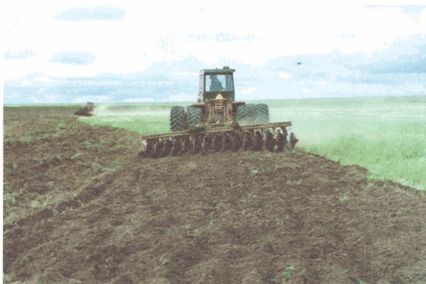
FIGURA 2. Gradagem em solo de Cerrado

Em áreas de mecanização intensiva é comum a existência de camadas compactadas ("pé de grade", "pé de arado"); neste caso, deve ser realizada a escarificação ou subsolagem com solo seco e, após o início das chuvas, efetuar duas gradagens, sendo uma com grade aradora e outra com grade niveladora (Figura 2).