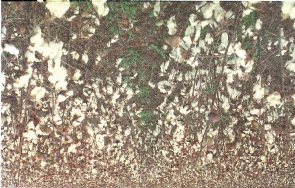
FIGURA 1 - CNPA Itamarati 90 em ponto de colheita