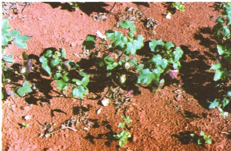
FIGURA 5. Plantas com sintomas do Mosaico das Nervuras f. Ribeirão Bonito

Esta doença, quando atinge plantas novas, chega a reduzir o porte em 80%, aliado à perda de produção, que pode chegar a 100%. Está associada à presença de pulgão, cigarrinhas e à ocorrência de noites e dias frios; não é transmitida pelas sementes nem de planta a planta, mas apenas de plantas hospedeiras para o algodoeiro. No Mato Grosso é altíssima a presença de guaxumas, gramíneas e outras plantas hospedeiras de pulgões e cigarrinhas, antes do preparo do solo e plantio do algodão. O controle deve ser efetuado através do plantio de cultivares resistentes (IAC 20, CNPA 7H, CNPA ITA 96, ITA 91-322, CNPA ITA 97 e CNPA ITA 92) e/ou do controle rigoroso do pulgão e outras pragas sugadoras. Comprovou-se, no Mato Grosso, que todas as cultivares de algodão oriundas dos Estados Unidos (Deltapine, Stoneville, Tamcot), da Austrália (CS, SICALA e SIOKRA) são altamente susceptíveis a esta doença (Freire et al. 1995). Em São Paulo, a cultivar IAC 22 apresenta 11,4% de plantas susceptíveis aos mosaicos (Fuzatto et al. 1995).