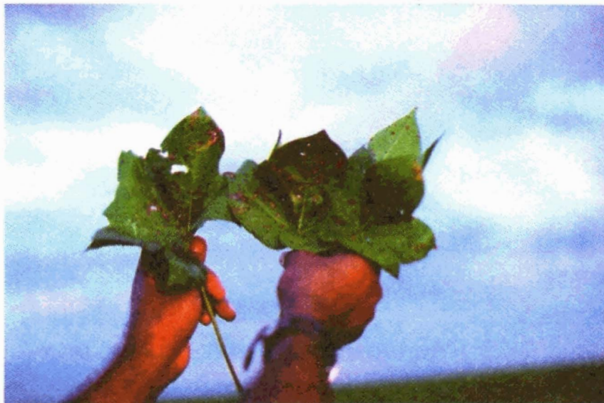
FIGURA 8. Manchas de Stemphylium

No Paraná foi efetuado isolamento desta doença, tendo sido encontrados 40,3% de isolados de Stemphylium , 1,1% de Alternaria e 58,5 de fungos não identificados. Os testes de patogenicidade para configuração dos postulados de Koch confirmaram que a doença é causada pelo fungo Stemphylium solani . Portanto, trata-se de uma nova doença do algodoeiro, que até então não era infectada por este fungo.