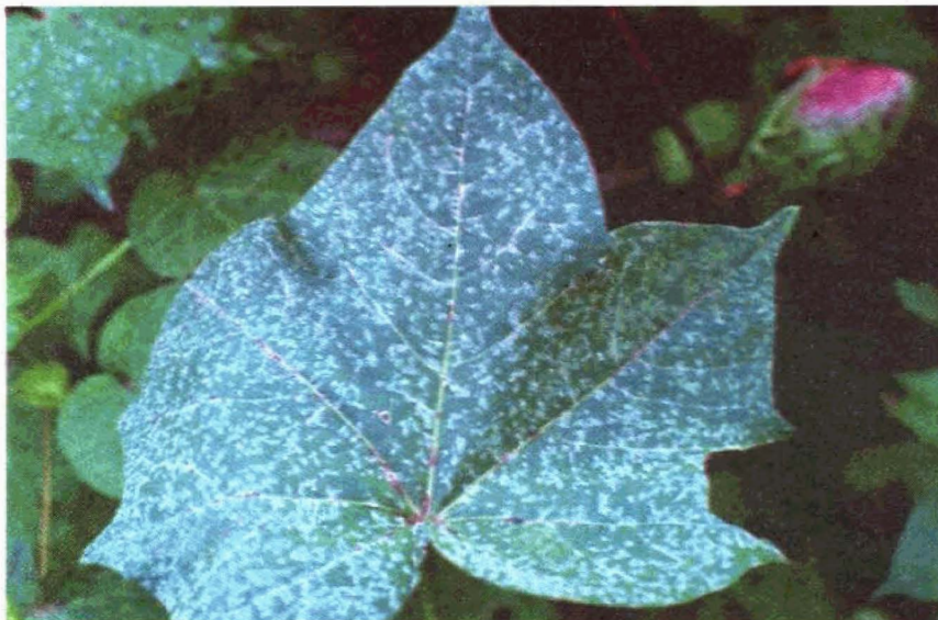
FIGURA 6. Mancha Branca ou Ramularia