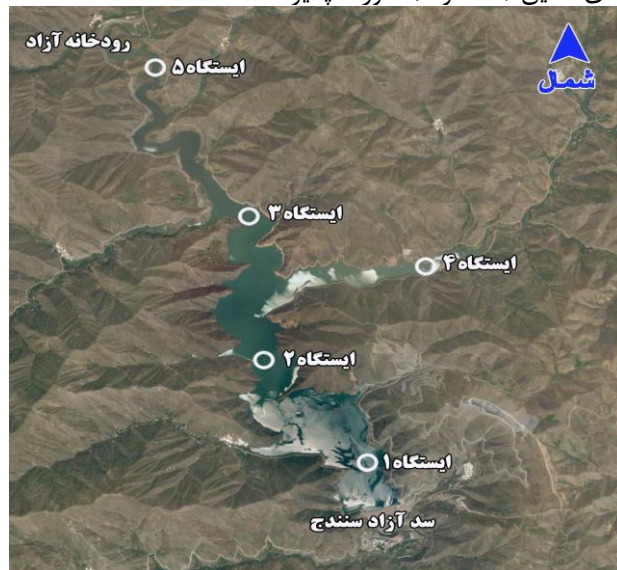
شکل ۱: نقشه ماهواره ای دریاچه سد آزاد سنندج و موقعیت جغرافیایی ایستگاههای نمونه برداری (کردستان، سال ۹۵-۱۳۹۴)

سد مخزنی آزاد سنندج در مسیر رودخانه مهم کوماسی (آزاد) ایجاد و در سال ۱۳۹۲ مورد بهره برداری قرار گرفت. این مطالعه در سال ۵-۱۳۹۴ در ۵ ایستگاه در ناحیه رودخانه ای (ایستگاه های ۴ و ۵)، انتقالی (ایستگاه ۳) و دریاچه ای (ایستگاه های ۱ و ۲) انجام شد. موقعیت جغرافیایی و نیز مشخصات هر ایستگاه در شکل ۱ و جدول ۱، آمده است. نمونه برداری بصورت ماهانه در لایه سطحی تمام ایستگاهها و نیز لایه های مختلف از ایستگاه های عمیق (۱، ۲ و ۳) صورت پذیرفت.