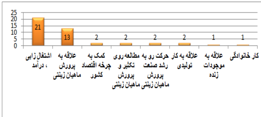
نمودار ۱: توزیع آماری فراوانی دلایل حضور در صنعت ماهیان زینتی

انتخاب شد. بدین ترتیب و با استفاده از مقادیر ویژه ۱۱ مربوط به مقادیر آمار اولیه و آمار نهایی که در جدول ۱ آمده است، هشت عامل گزارش شد. البته از آنجا که در تحلیل عاملی، عواملی انتخاب می‌گردند که مقدار ویژه آنها بیشتر از یک باشد، در اینجا این هشت عامل تأیید شد.