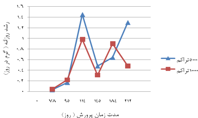
شکل ۲: تغییرات میزان رشد روزانه ماهی کفال خاکستری در سال اول پرورش با تراکم ۵ و ۱۰ هزار عدد در هکتار