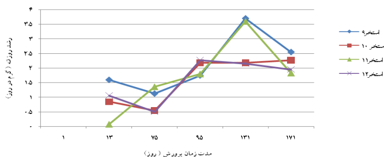
شکل ۴: تغییرات میزان رشد روزانه (گرم در روز) کفال خاکستری در سال دوم پرورش در تیمارهای مختلف

آب کلیه استخرها از یک منبع و کانال تامین شده و به دلیل یکنواختی در اندازه و شکل و ارتفاع آبیگری استخرهای پرورشی، دمای آب آنها در طول مدت پرورش یکسان بوده است. حداقل و حداکثر درجه حرارت آب کلیه استخرها به ترتیب ۸/۴ و ۲۸/۲ سانتی گراد در ماههای دی و تیر بود. دامنه درجه حرارت مناسب برای تغذیه ۲۰-۲۸ درجه سانتی گراد می باشد که این دامنه دمای آب در منطقه معمولا در بین ماههای اوایل اردیبهشت تا اواخر مهر ماه مشاهده می شود. میزان حداقل و حداکثر شوری آب استخرها به ترتیب ۲۳.۳ و ۳۲ ppt بود. میزان حداقل و حداکثر شفافیت آب استخرها به ترتیب ۲۴ و ۵۰ سانتی متر در تیر ماه و بهمن بود. حداقل پی اچ در صبحها ۷/۶ و حداکثر آن در بعد از ظهر ۸/۸ بوده است. دامنه میزان اکسیژن محلول ثبت شده استخرها ۴.۵ - ۷.۶ میلی گرم در لیتر و این میزان برای BOD_5 ۱.۱۵ تا ۳.۲ میلی گرم در لیتر برآورد گردید. در مورد میزان