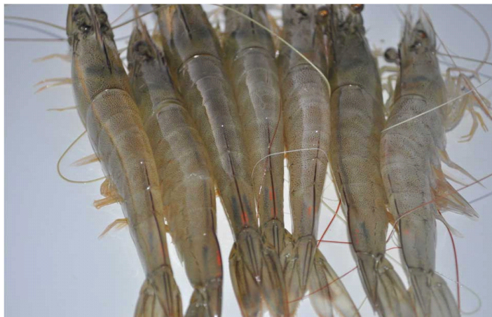
شکل ۲: تعدادی از میگوهای بازگیری شده موزی ( F. merguensis ) در آبهای هرمزگان (۱۳۸۹)

در فرمول های فوق میزان رشد ( G_w ) برابر با اختلاف میانگین وزنی رشد میگوها در هنگام رهاسازی ( G_i ) با وزن میگوهای بازگیری شده ( G_f ) می باشد. نرخ رشد ( kw ) بر اساس افزایش وزن ( dw ) به فاصله زمانی در هفته ( dt ) می باشد.