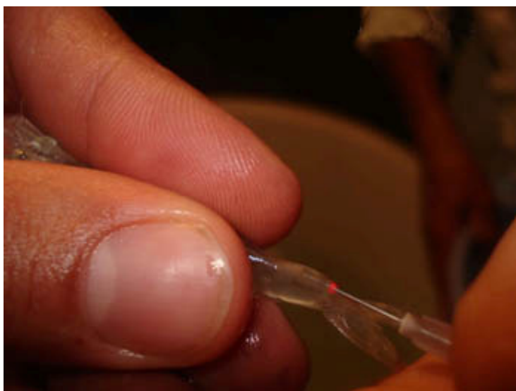
شکل ۱: تزریق مایع قرمز رنگ در ناحیه تلسون میگوی موزی ( F. merguensis ) در هرمزگان (۱۳۸۹)

از استخرهای پرورشی تعدادی از نوزادان از ترکیب میگوهای برداشت شده، جدا سازی و علامتگذاری شدند. علامتگذاری با