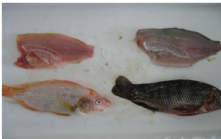
شکل ۱: ماهی تیلاپیای کامل و فیله