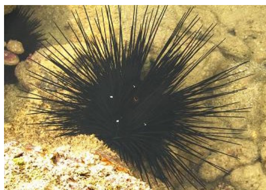
شکل ۲: نمونه‌های زنده (راست) و تثبیت شده (چپ) گونه Diadema setosum