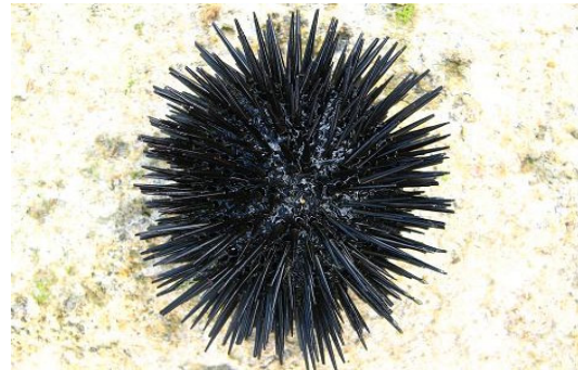
شکل ۳: نمونه‌های زنده (راست) و تثبیت شده (چپ) گونه Echinometra mathaei