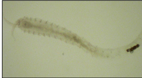
شکل ۴: کرم پرتار Parhypania brevispinis

جدول ۲: میانگین ( \pm انحراف استاندارد) تراکم و زیتوده ماکروبتوزها در اعماق و فصول مختلف