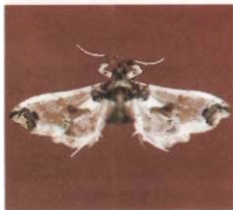
FIG. 1. Adulto da broca pequena do tomateiro

sépalas e nos frutos verdes, quando apresentam cerca de 12 a 20 mm de diâmetro. Em infestações muito elevadas, são encontradas posturas também sobre as folhas. As lagartas, quando completamente desenvolvidas, medem cerca de 11 a 13 mm de comprimento, possuem coloração rosada uniforme, com o primeiro segmento torácico amarelado (Fig. 3). Penetram nos frutos por qualquer parte desses e, em torno de 25 dias, quando completam o seu desenvolvimento, abandonam os mesmos e passam a pupa (Fig. 4) no solo, em detritos existentes em torno da planta, protegida por um delicado casulo. O período médio compreendido entre a eclosão da lagarta e a penetração no fruto é de 70,3 minutos (Carneiro et al. 1996). O orifício de penetração das lagartas de primeiro ínstar é quase imperceptível. Os danos são evidenciados próximo à colheita do primeiro cacho. As lagartas, ao abandonarem os frutos, deixam um orifício de saída (Fig. 5), tornando-os imprestáveis para a comercialização (Fig. 6) (Lepage, 1944; Zucchi et al., 1993; Carneiro et al., 1996; Haji et al., 1998).