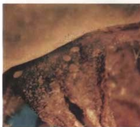
FIG. 2. Ovos da broca pequena do tomateiro