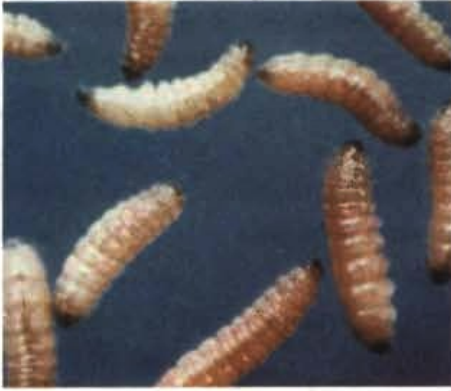
FIG. 3. Lagartas da broca pequena do tomateiro