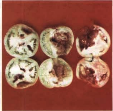
FIGs. 5 e 6. Danos ocasionados em frutos de tomate pela broca pequena do tomateiro