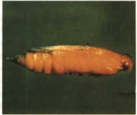
FIG. 4. Pupa da broca pequena do tomateiro