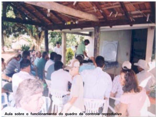
Aula sobre o funcionamento do quadro de controle reprodutivo

Em 15 de abril de 2003, produtor e extensionistas visitaram a unidade de demonstração de Nhandeara (região de São José do Rio Preto, SP), com o objetivo de aprender mais sobre o manejo do capim-mombaça.