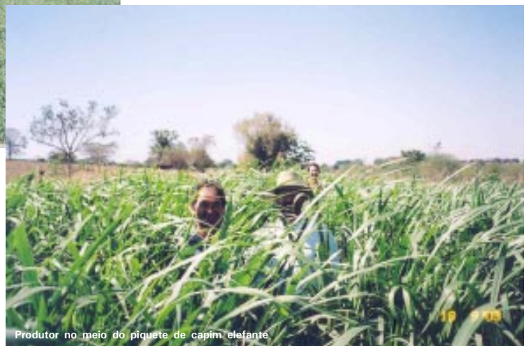
Produtor no meio do piquete de capim elefante