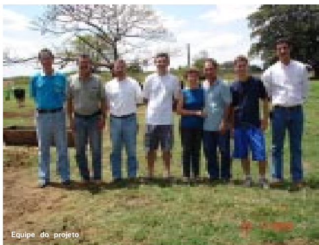
Equipe do projeto