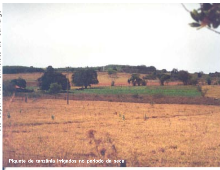
Piquete de tanzânia irrigados no período da seca