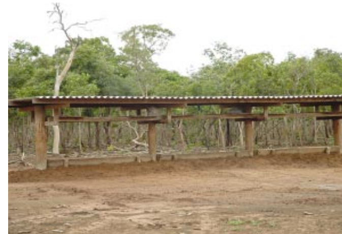
Figura 1. Cocho para suplementação mineral, com espaço para armazenar reserva de sal – Fazenda Jacarandá, Araguaiana, MT.

Para o dimensionamento dos bebedouros, além de se garantir o mínimo de 4 cm lineares/UA, é preciso considerar o volume armazenado no reservatório e a vazão da água. O consumo de água pelos animais ao longo do dia tem alta correlação com a temperatura ambiente; quanto maior for a temperatura, tanto maior será o consumo de água (Figura 2).