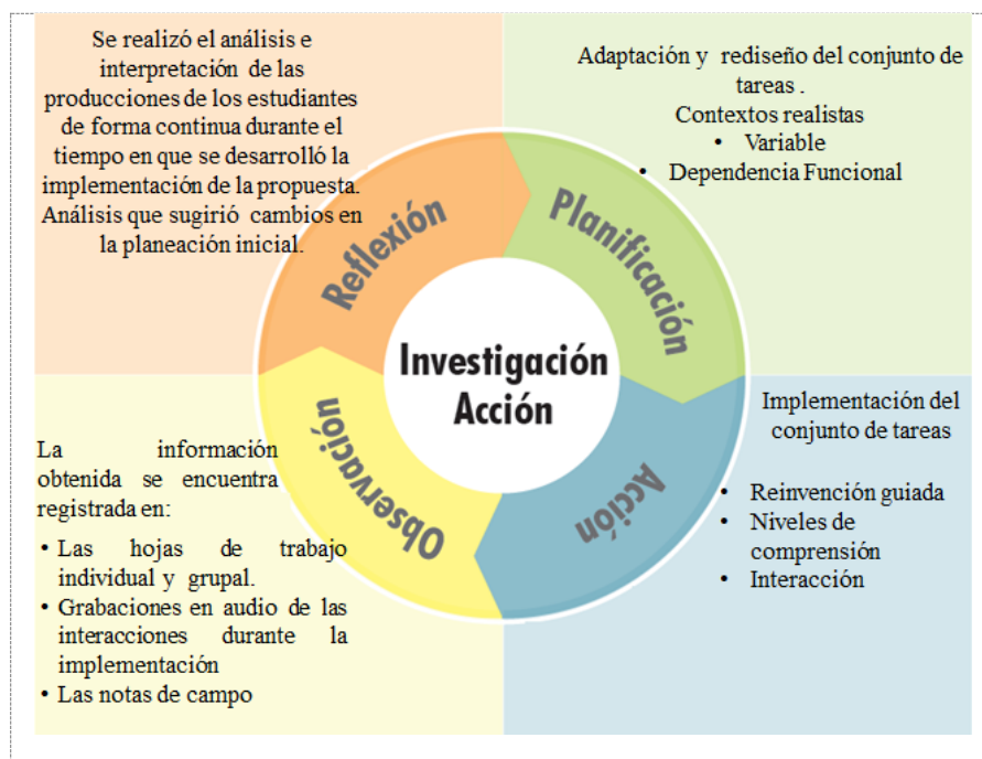
Figura 1. Actividades desarrolladas en cada fase

Respecto a la fundamentación del conjunto de tareas, puedo mencionar que en primer lugar se adelantó un análisis fenomenológico del concepto, y en segunda instancia, se consideraron algunas herramientas teóricas y metodológicas del enfoque de la EMR, determinantes en el ajuste e implementación de la propuesta, la cual se desarrolló a partir de un conjunto de seis tareas, que cuentan con situaciones problema cuya solución no es inmediata, donde la variable y la dependencia son elementos constitutivos en la comprensión del objeto matemático función lineal y afín. El diseño de esta conjunto de tareas, es el resultado de ajustar los instrumentos propuestos por Posada y Villa (2006) y por Vergel y León (1997).