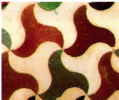
Figura 1. Tesela Nazarí Pajarita

Se realizará en primer lugar, la tesela de la pajarita (figura No.1), siendo esta una de las más sencillas, que parte de un triángulo equilátero y teniendo como base el punto medio de los lados, se hacen rotaciones de 180^\circ :