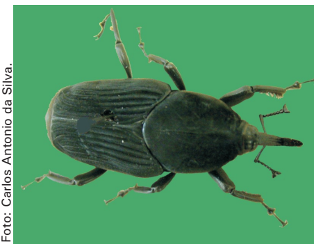
Figura 3. Adulto de Rhynchophorus palmarum , a broca-do-olho-do-coqueiro.