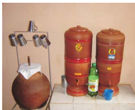
Fig. 4. Armazenamento e tratamento da água de beber.

A cloração é uma das formas mais eficientes para tratamento da água e impedição da proliferação das principais doenças infecciosas, como