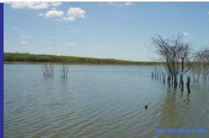
Fig. 1. Fonte de água natural.

A água na natureza raramente é pura, por ser uma substância quimicamente muito ativa. Apresenta grande facilidade de dissolver e reagir com outras substâncias orgânicas e inorgânicas presentes no ambiente, alterando sua composição físico-química e biológica e, conseqüentemente, sua qualidade (Fig. 1).