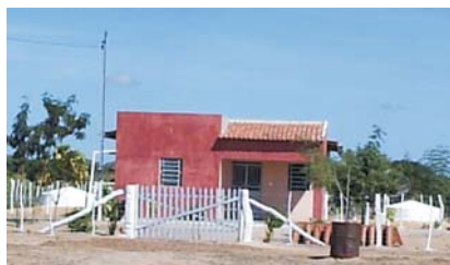
Fig. 2. Cisternas de placas pré-moldadas com 8,0m 3 cada.

A Fig. 2 apresenta uma residência na comunidade de Atalho, Petrolina-PE, contendo duas cisternas com capacidade de 8,0 m 3 cada. Esta alternativa possibilita à família, no período sem chuvas, utilizar uma cisterna com água tratada para beber e a outra com água para demais usos domésticos.