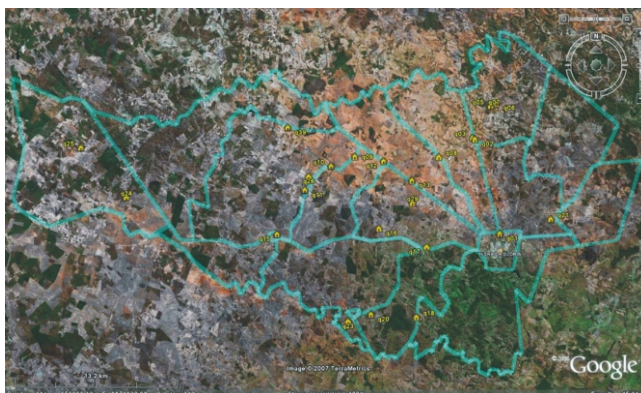
Figura 1- Queijarias georreferenciadas no município de Nossa Senhora da Glória – SE (2006).