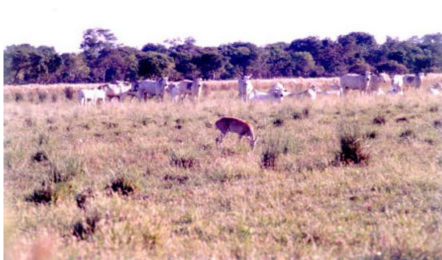
Foto 3 – No Pantanal, os bovinos vivem em conjunto com os grandes

herbívoros silvestres, como o veado campeiro.