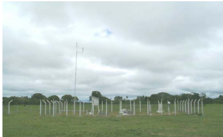
Fig. 2 – Estação climatológica de Nhumirim.

A estação climatológica de Nhumirim (figura 2), talvez a única estação completa dentro da planície pantaneira, faz parte de um convênio da Embrapa com o Instituto Nacional de Meteorologia- INMET. É feito o monitoramento dos elementos climáticos chuva (mm); temperatura do ar (máxima, mínima e média (°C)); umidade relativa do ar (%), evaporação do ar (mm), insolação (horas e décimos) e evaporação do Tanque Classe “A” (mm).