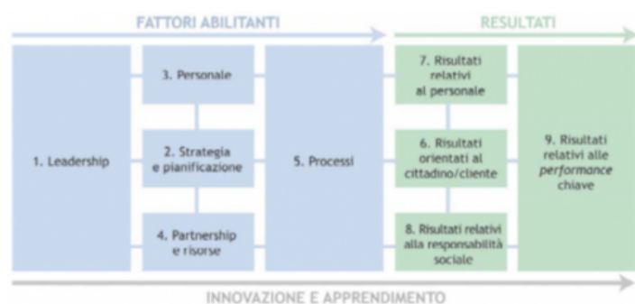
Figura 2 - Il modello Caf

L'approccio sistemico dell'analisi considera le reciproche influenze tra i fattori abilitanti (le cause) e i risultati (gli effetti) ritenute molto importanti nei processi di autovalutazione. Un'organizzazione dovrebbe sempre sorvegliare la coerenza tra i risultati e le informazioni raccolte sui fattori abilitanti. Assimilare gli esiti di tale analisi nelle prassi gestionali costituisce il ciclo dell'innovazione e dell'apprendimento continui (Eipa, 2014).