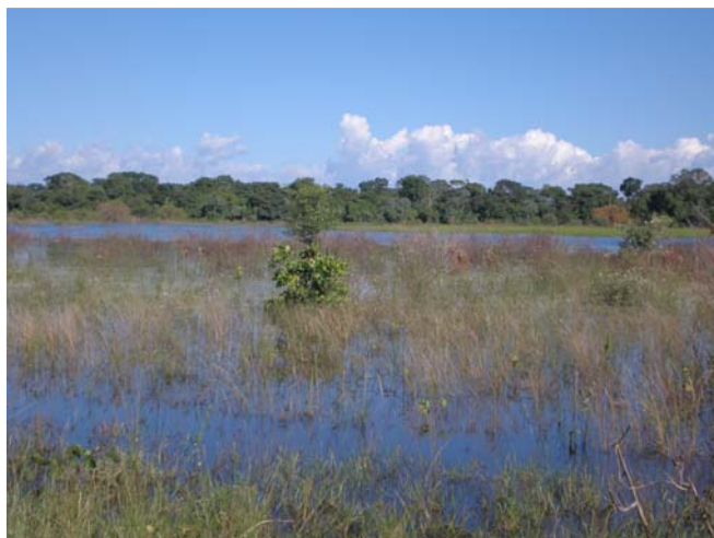
Figura 2. Invernada 9 parcialmente inundada – fazenda Nhumirim, março de 2007.