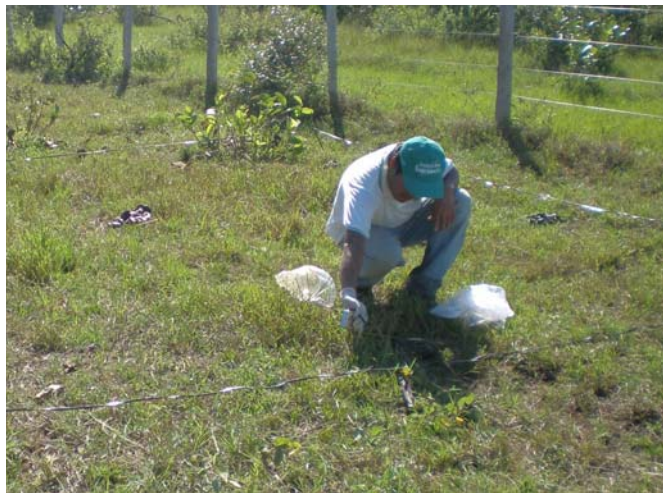
Figura 3. Coleta de placas de fezes frescas para análises químicas (março de 2007).

O nitrogênio total das fezes bovinas foi determinado pelo método semimicro Kjeldahl após digestão sulfúrica (Silva, 1999, adaptado por Galvani & Gaertner, 2006).