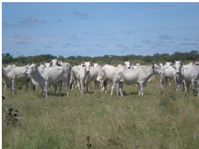
Figura 1. Rebanho constituído por vacas de cria (fevereiro de 2007).

A área de estudo compreendeu uma invernada de 151 hectares, onde foram mantidas desde fevereiro de 2007, sob manejo contínuo, um rebanho de 51 vacas de cria da raça Nelore (Figura 1), na taxa de lotação moderada (3,0 ha / cabeça). Esta área sofreu inundação parcial entre fevereiro e março de 2007 (Figura 2).