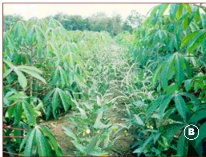
Fig. 1. Arranjo espacial de plantas de mandioca com arroz de terras altas e feijão-caupi, em área de agricultura familiar em a) Regeneração-PI, 2001 (Sagrilo, 2002), e b) Chapadinha-MA, 2005