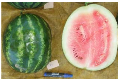
Fig. 7. Aspecto externo e interno do híbrido TPC 00398.

O híbrido 'TCP 00398' produziu plantas vigorosas e compactas. O ciclo foi de cerca de 90 dias. Os frutos apresentaram formato oblongo, levemente alongados, com casca verde-claro e listras escuras e bem definidas. A polpa apresentou sabor muito doce, de coloração vermelho-claro, textura firme e fibrosa. A produtividade média foi de 19,93 t/ha, o peso médio de fruto foi de 6,46 kg e o teor de sólidos solúveis foi de 12,4 °brix. O comprimento e a largura de fruto foram de 25,9 cm e 21,0 cm, respectivamente.