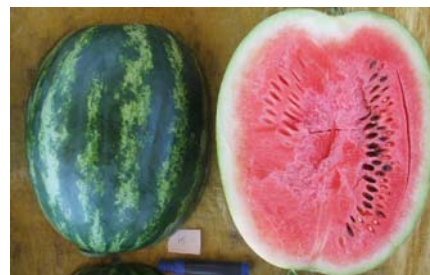
Fig. 4. Aspecto externo e interno de fruto do híbrido Eureka.

A produtividade média foi de 26,41 t/ha, o peso médio de fruto foi de 7,48 kg e o teor de sólidos solúveis foi de 11,0 °brix. O comprimento e a largura de