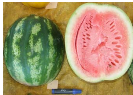
Fig. 8. Aspecto externo e interno do híbrido TCP 00779.

doce, coloração vermelho-claro e textura macia. A produtividade média foi de 17,83 t/ha, o peso médio de fruto foi de 4,76 kg e o teor de sólidos solúveis foi de 12,0 °brix. O