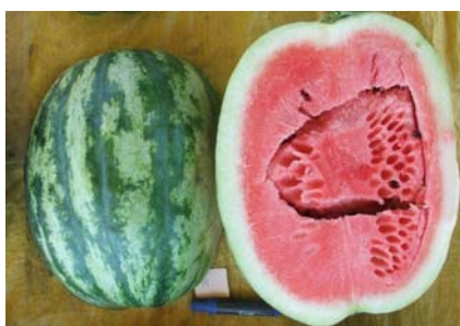
Fig. 2. Aspecto externo e interno de fruto do híbrido Jetstream.

A produtividade média foi de 29,46 t/ha, o peso médio de fruto foi de 7,96 kg, o teor de sólidos solúveis foi de 11,3 °brix, a largura de fruto foi de 23,0 cm, a espessura de