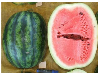
Fig. 6. Aspecto externo e interno de fruto do híbrido TCP 00248.

O híbrido 'TCP00248' apresentou plantas vigorosas e compactas. O ciclo foi de cerca de 85 dias. Os frutos apresentaram formato oblongos, com casca listrada e sulcada (depressão longitudinal, leve que divide a casca