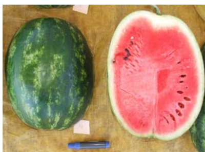
Fig. 3. Aspecto externo e interno de fruto do híbrido Top Gun.

Atualmente, o híbrido 'Top Gun' é um dos preferidos dos produtores da região central do país. As plantas desse híbrido apresentaram porte compacto, baixa prolificidade e ciclo mais precoce (cerca de 70 dias). A