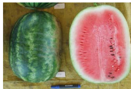
Fig. 5. Aspecto externo e interno do híbrido Mirage.

de sólidos solúveis foi de 10,8 °brix. Esse híbrido também se destacou pela espessura da casca que foi de 2,55 cm no pedúnculo e de 1,20 cm na