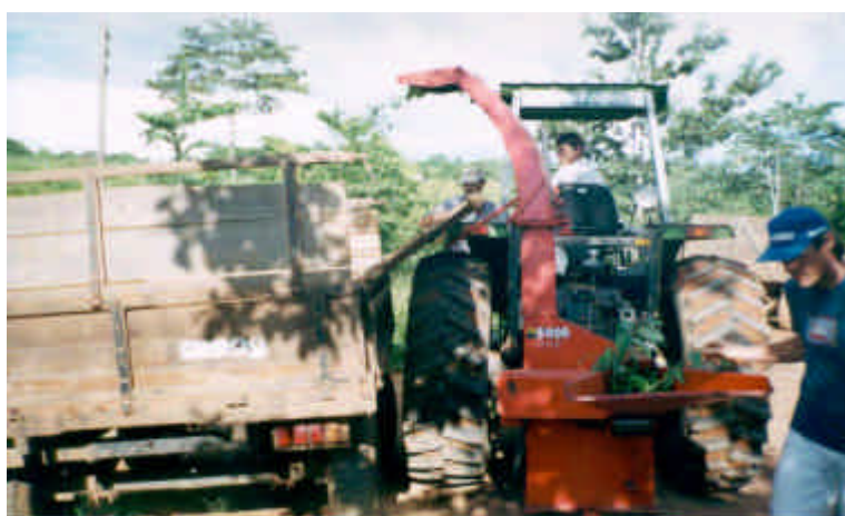
FIG 1. Trator acoplado ao triturador de forragem.

pela tomada de potência (TDP) por meio de eixo cardan. O rotor responsável pela trituração de materiais vegetais é composto por três facas dispostas de forma radial em ângulo de 120°. O sistema de operacionalização deve funcionar da seguinte forma: trator na marcha lenta (640 RPM no motor e 165 RPM na TDP) e triturador com alimentação lenta. Para outros tipos de equipamentos, com condições de operações diferentes, devem-se realizar alguns testes preliminares a fim de observar o tamanho do material triturado, evitando possíveis perdas nos processos de secagem e destilação.