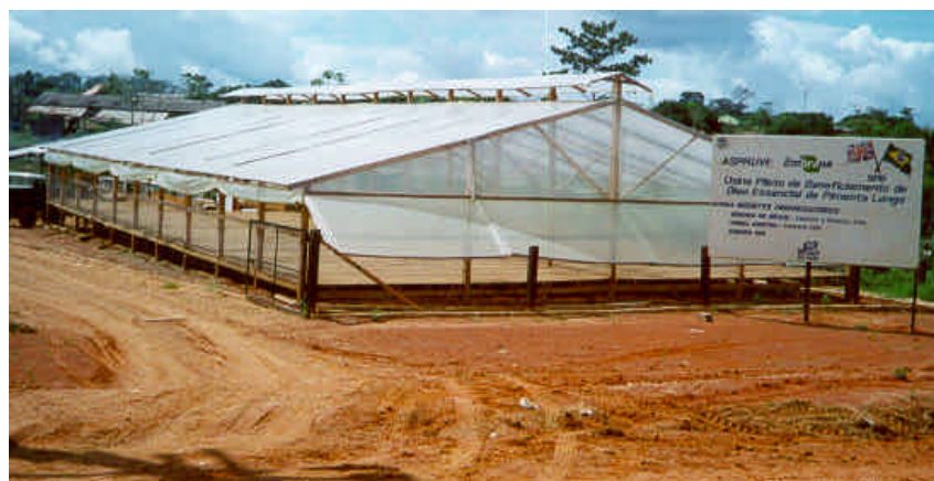
FIG 2. Secador solar de biomassa de pimenta longa.

Dando continuidade à etapa anterior, a biomassa triturada é distribuída em secador solar (Fig. 2) constituindo uma camada de até 15 cm de altura, por um período de quatro dias para perda de umidade. Visando evitar a fermentação e facilitar a aeração durante o processo de secagem, deve-se revirar a matéria-prima pelo menos duas vezes ao dia, nas horas mais quentes da manhã e da tarde. A temperatura interna da biomassa não pode exceder 39°C.