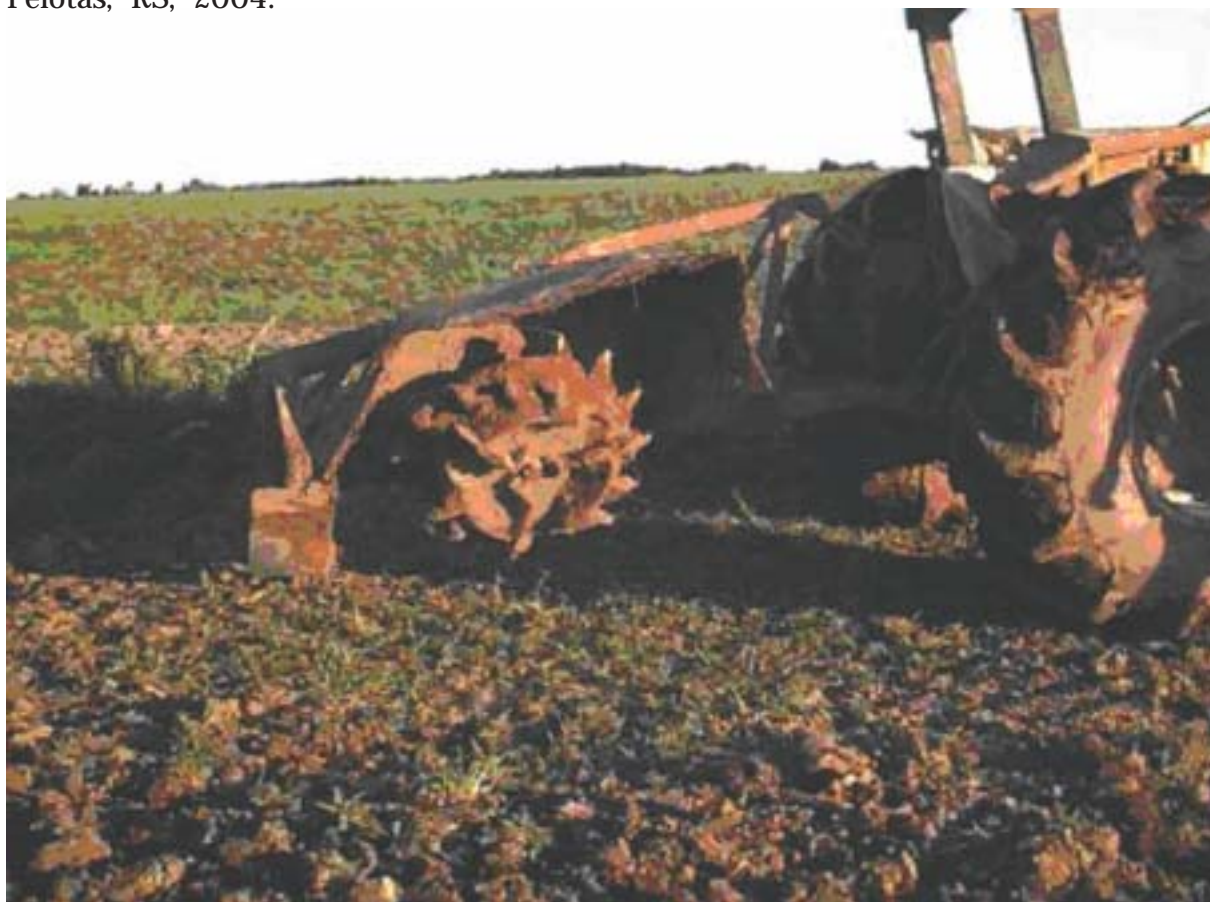
Figura 7. Acabamento do dreno entre os camalhões com emprego de valetadeiras. Turucú, RS, 2004.