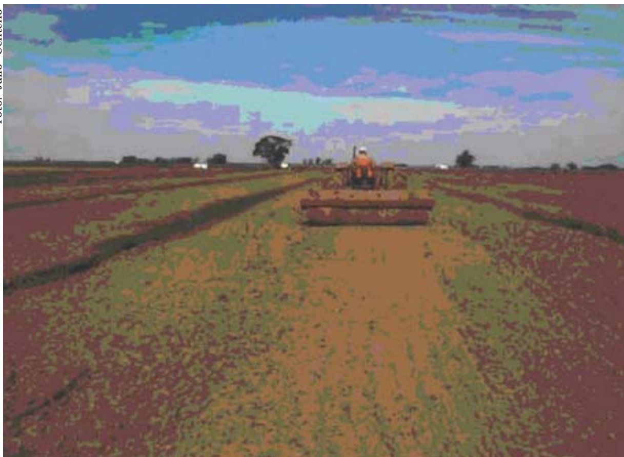
Figura 6. Acabamento do camalhão com emprego de rolos compactadores. Pelotas, RS, 2004.