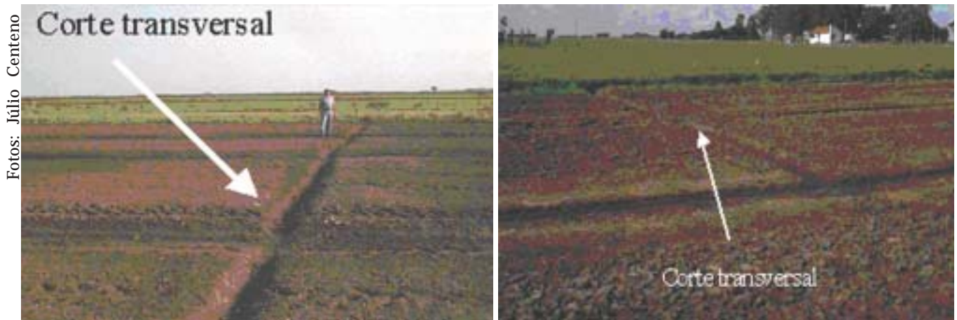
Figura 8. Corte transversal do camalhão com drenos, para esgotar possíveis pontos de alagamento. Rio Grande, RS, 2003.

Ainda, dependendo do microrelevo, os camalhões deverão ser cortados transversalmente com drenos, para esgotar possíveis pontos de alagamento (Figura 8).