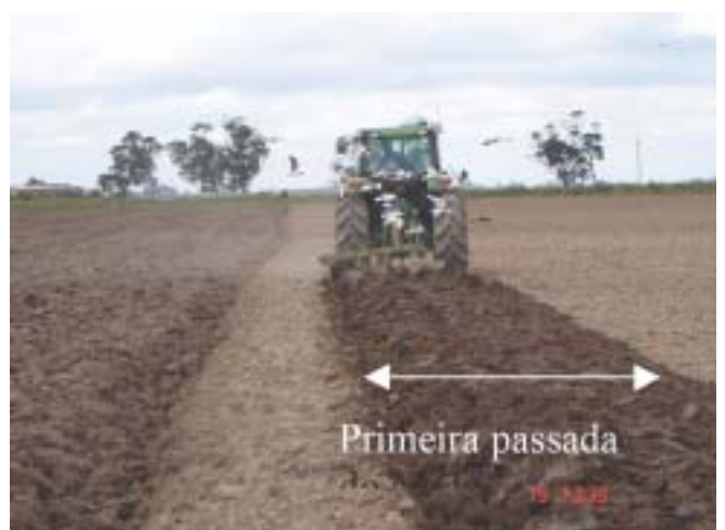
Figura 4. Utilização do “bigode” (esquerda) para orientação do início (direita) do preparo do camalhão, Pelotas, RS, 2006.