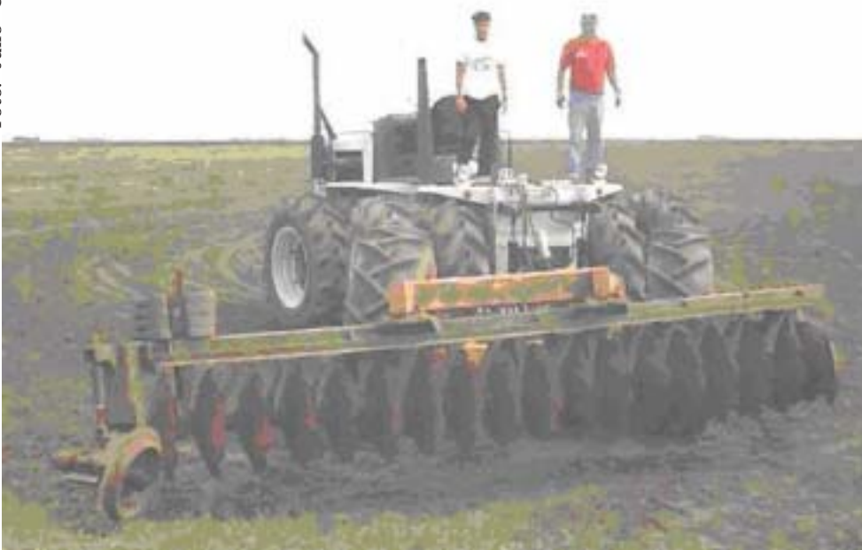
Figura 2. Camalhões largos sendo construídos com arado gradeador (adaptado pelo produtor), Rio Grande, RS, 2003.