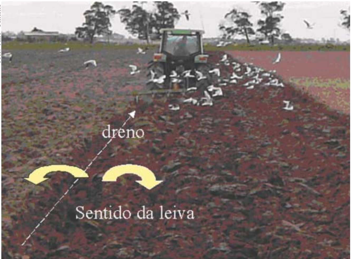
Figura 5. Formação do dreno entre os camalhões. Pelotas, RS, 2006.

Terminada esta primeira fase da construção, inicia-se a fase de acabamento do camalhão com emprego de grades e rolos compactadores. Alguns cuidados são recomendados durante o emprego de grades de disco: o primeiro, é que os discos do último pente da grade tombem o solo para dentro do camalhão, evitando-se assim que os drenos sejam entupidos ou até eliminados. Também deve-se ter cuidado para não utilizar discos maiores no primeiro pente, pois neste caso, o volume de solo movimentado para fora, em direção aos drenos, será maior do que o volume movimentado pelos discos do último pente. Esta situação é bastante comum devido à prática, entre os produtores, de reporem, preferencialmente, os discos no pente da frente da grade. Finalmente, recomenda-se que o disco mais externo do último pente