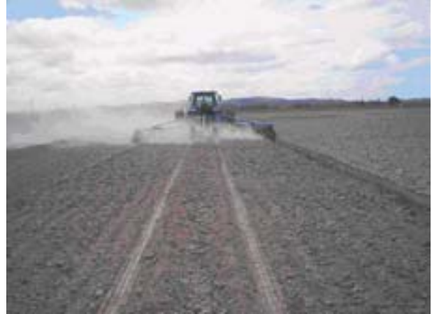
Figura 3. Camalhões largos sendo construídos com terraceadora, Pelotas, RS, 2003.

A construção dos camalhões com arados convencionais deve ser iniciada pelo seu centro, tombando-se as leivas de forma convergente, com tantas faixas de lavração quantas forem necessárias para atingir a largura desejada do camalhão? conhecido, popularmente, por lavrado em verga (nota do autor). O número de passadas com arado, grade ou lâmina, para atingir a largura desejada do camalhão, vai depender da área trabalhada pelo equipamento. Para identificar o centro do camalhão pode-se utilizar um “bigode no trator” – procedimento popular de utilizar uma