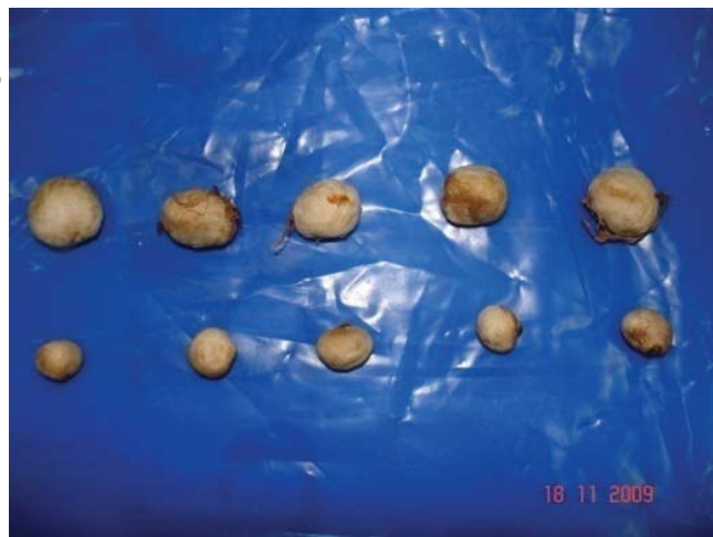
Figura 1. Tamanho de sementes médias (10 mm) e pequenas (6 mm) de pitangueira. Embrapa Clima Temperado, Pelotas-RS, 2010.

A semeadura foi realizada em novembro de 2009, sete dias após a extração das sementes, as quais foram postas para germinar em caixas de isopor de 72 células e mantidas em casa de vegetação da Embrapa Clima Temperado. Os substratos foram umedecidos manualmente à medida que era necessário.