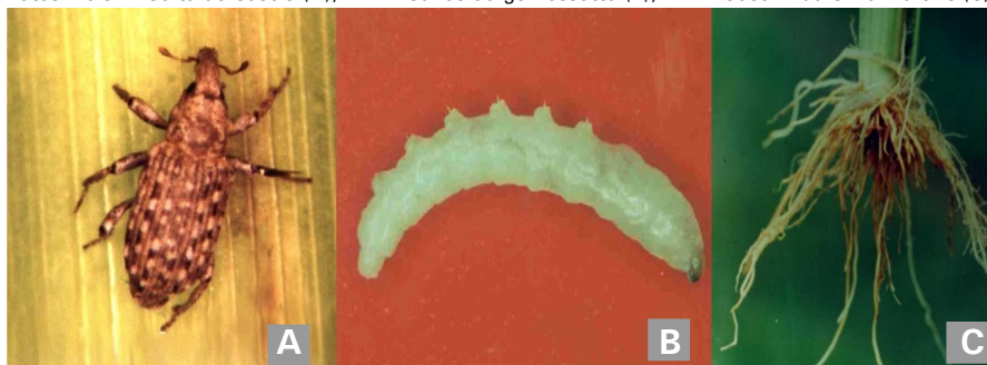
Figura 3. Principais espécies de insetos-praga da fase de pré-perfilhamento da cultura do arroz no Brasil e caracterização de danos. Gorgulho-aquático [ Oryzophagus oryzae : inseto adulto (A); larva (B); raiz danificada (C)]. Embrapa Clima Temperado, Pelotas – RS, 2009.