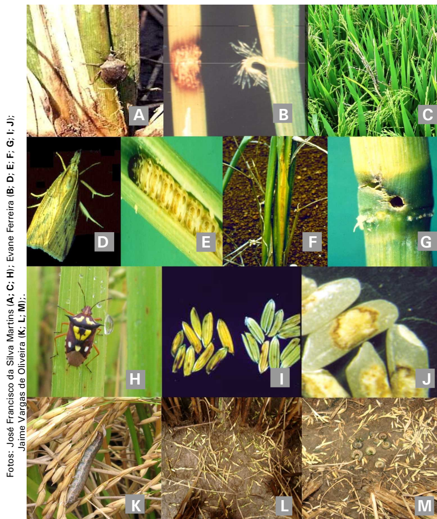
FIGURA 4. Principais espécies de insetos-praga que ocorrem na fase reprodutiva da cultura do arroz no Brasil e caracterização de danos. Percevejo-do-colmo [ Tibraca limbativentris : inseto adulto (A); necrose do colmo (B); panícula branca (C)]; Broca-do-colmo [ Diatraea saccharalis : mariposa (D); lagarta (E); bainha-da-folha raspada (F); colmo perfurado (G)]; Percevejo-do-grão [ Oebalus poecilus : inseto adulto (H); espiguetas vazias e grãos defeituosos (I); endosperma manchado (J)]; Lagarta-da-panícula [ Pseudaletia spp.: lagarta (K); panículas cortadas (L; M)]. Embrapa Clima Temperado, Pelotas – RS, 2009