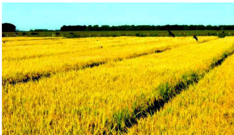
Figura 3. Arroz irrigado (cv. BRS 7 "Taim"). Última cultura do experimento E5, que envolveu o sistema de culturas arroz-milho-soja-arroz.