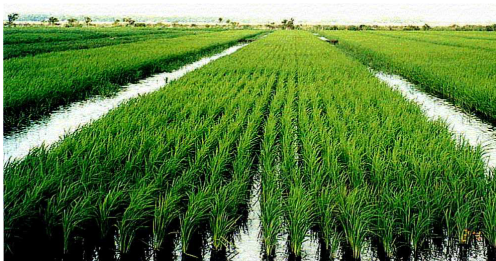
Foto. Caracterização do cultivo do arroz (cv. BRS 6 "Chuí"), no experimento E5. Início do sistema de culturas arroz-milho-soja-arroz.