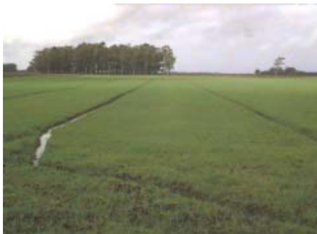
Figura 4. Camalhões cultivados com pastagem, em áreas de várzeas, Osório RS, 2003.