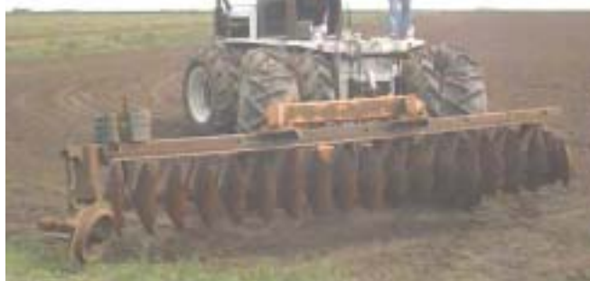
Figura 2. Camalhões largos sendo construídos com arado-gradeador, Rio Grande, RS, 2004.