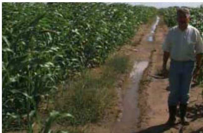
Figura 6. Camalhões cultivados com sorgo silageiro, em áreas de várzeas, Rio Grande RS, 2002.

Espera-se com esta tecnologia implantar rotações e sucessões de culturas durante o pousio do cultivo do arroz - aumentando o lucro, viabilizando e racionalizando a aquisição e utilização de equipamentos e permitindo o aumento ou retenção da mão-de-obra. Espera-se também melhorar o controle integrado de invasoras, de insetos e doenças e a eficiência do uso do solo.