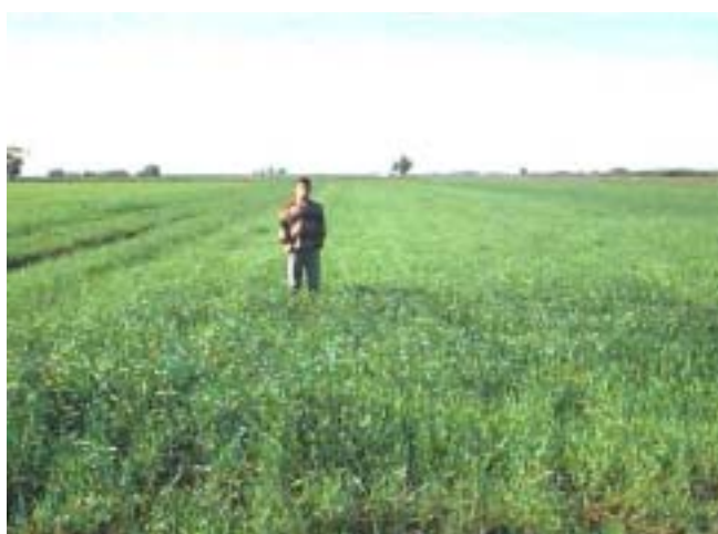
Figura 5. Camalhões cultivados com trigo, em áreas de várzeas, Pelotas, RS, 2004.