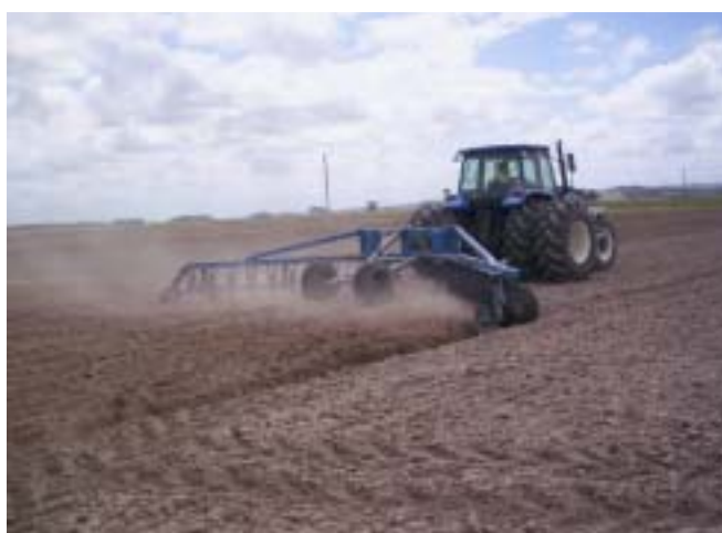
Figura 3. Camalhões largos sendo construídos com terraeadora, Pelotas, RS, 2004.