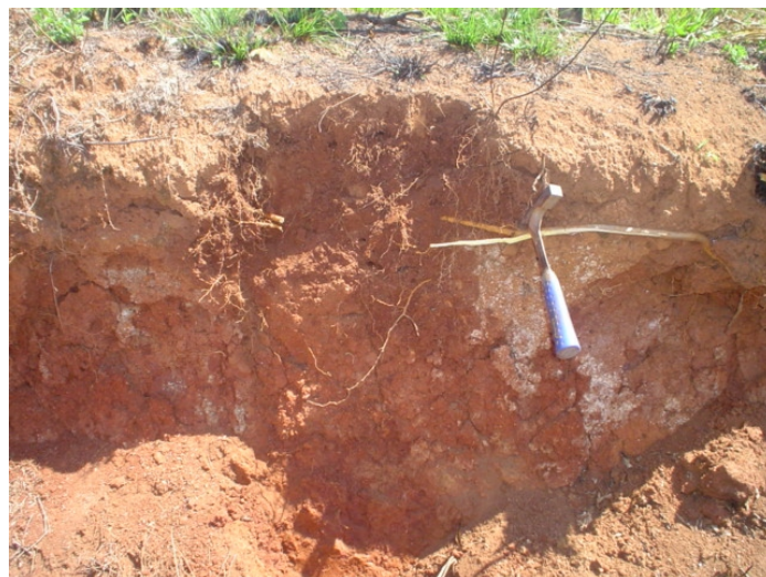
Fig.18. Argissolo Vermelho Distrófico abruptico (arênico) . São solos profundos com ocorrências alternadas em superfícies mais antigas de Tb Alumínico; raros são Ta Eutróficos.