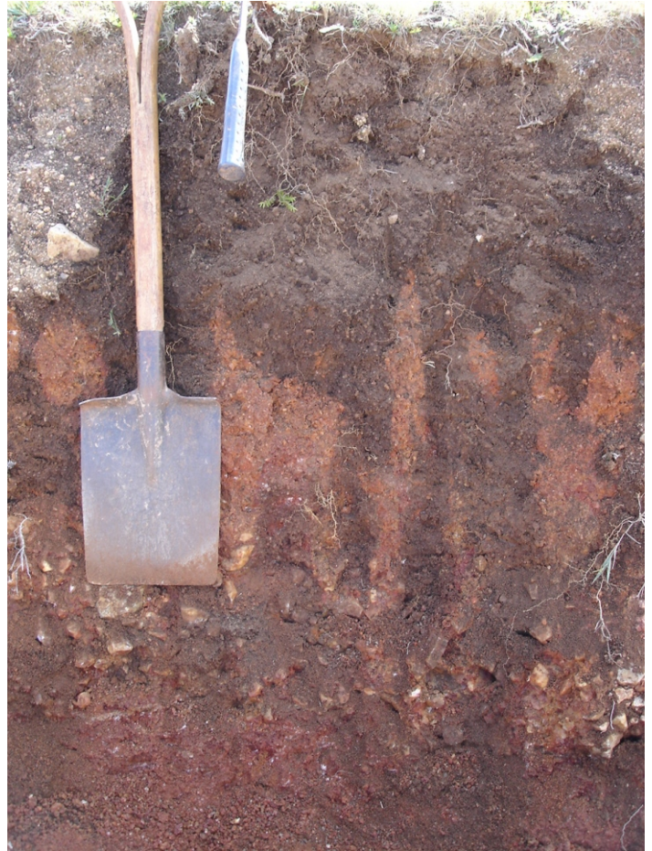
Fig.42. Cambissolo Húmico Distrófico típico nas bordas das serras onde havia floresta anteriormente. Embora no atual estágio do Sistema Brasileiro não esteja previsto o subgrupo glóssico esse é o que melhor representaria este solo.