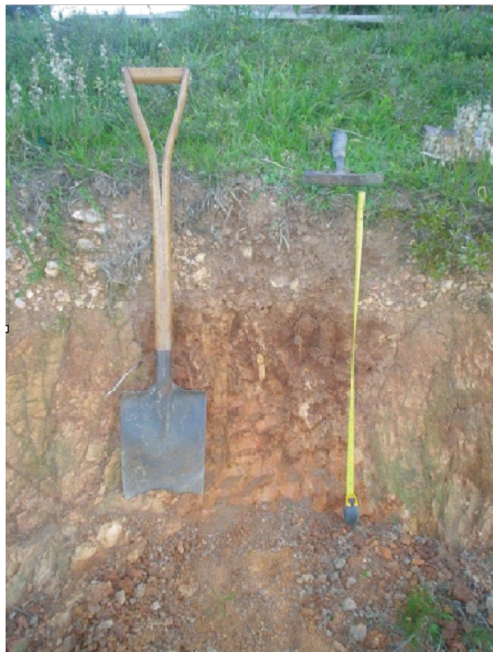
Fig.47. Neossolo Regolítico Húmico cambissólico (saprólítico) desenvolvido de pelitos e arcóseos muito finos do complexo metamórfico Porongos na "Serra das Encantadas". A evolução das encostas contribui para o estabelecimento de um manto cascalhento na superfície que se acumula progressivamente.