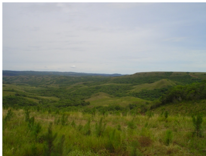
Fig.51. Formas de relevo típicas das serras rochosas, pouco íngremes que se iniciam por vales rochosos. À direita, topo de platô sedimentar da unidade Sr 0 , cultivos de pinus próximos ao rio Camaquã.

Pertencem a classe VI-se de capacidade de uso que são próprias as pastagens melhoradas ou até mesmo cultivadas. As partes mais íngremes comportam cultivos mais específicos de florestamento.