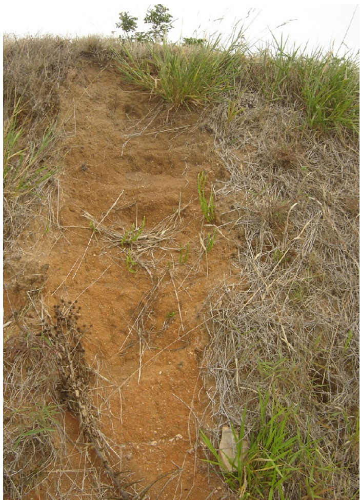
Fig. 27. Argissolo Vermelho-Amarelo Distrófico abruptico de ocorrência dominante nas terras altas do planalto de Encruzilhada do Sul.