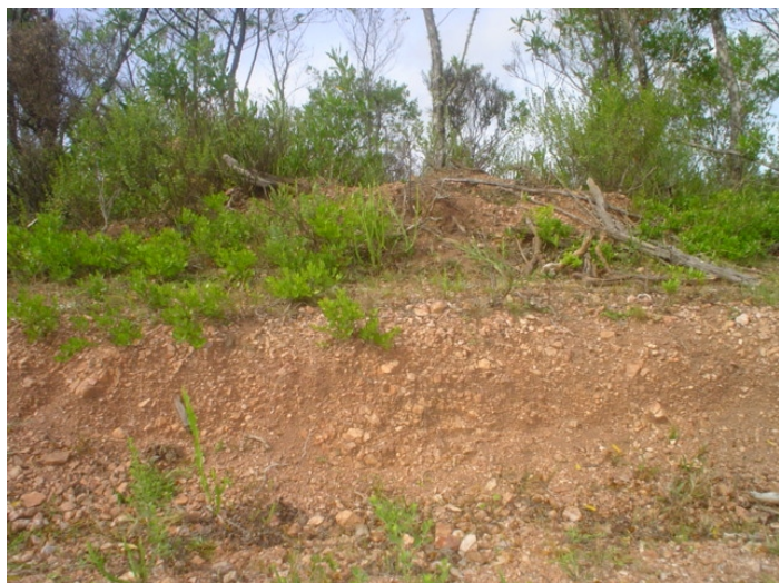
Fig.49. Neossolo Regolítico Distrófico saprolítico na região de serras. Mantos cascalentos superficiais cobrem as rochas constituindo solos pouco aproveitáveis para a agricultura.