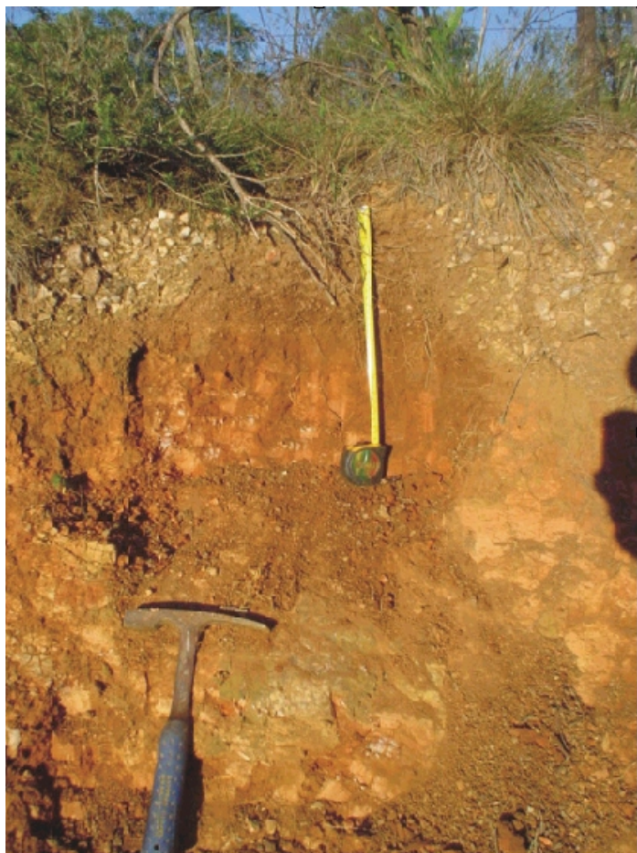
Fig.46. Cambissolo Háplico Tb Distrófico húmico (saprólítico) desenvolvido do complexo metamórfico Porongos composto por pelitos e arcóseos finos na "Serra das Encantadas"

Quanto ao uso agrícola, as terras são próprias à silvicultura, entretanto, o uso atual tem sido com a criação de ovelhas.