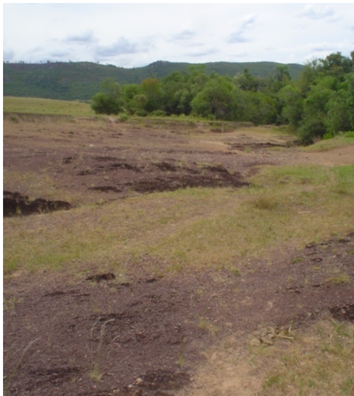
Fig.36. Superfícies rochosas expostas de rochas vulcânicas ácidas da formação Arroio dos Nobres constituindo vales aplainados nas bases por onde são drenadas as águas provenientes das serras.