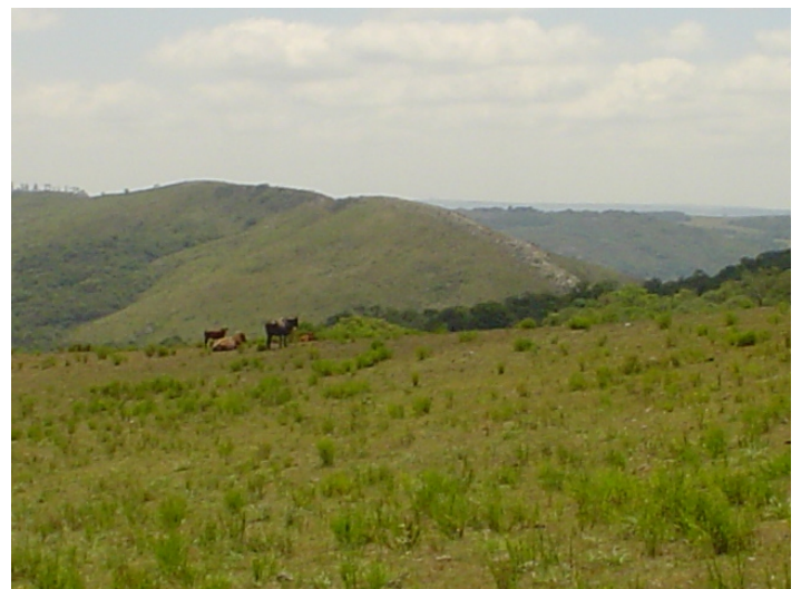
Fig.9. Linha de falhamento geológico na região de serras. Situa-se como divisor de águas de sub-bacias hidrográficas. Compõem os campos de pecuária extensiva do município de Encruzilhada do Sul.