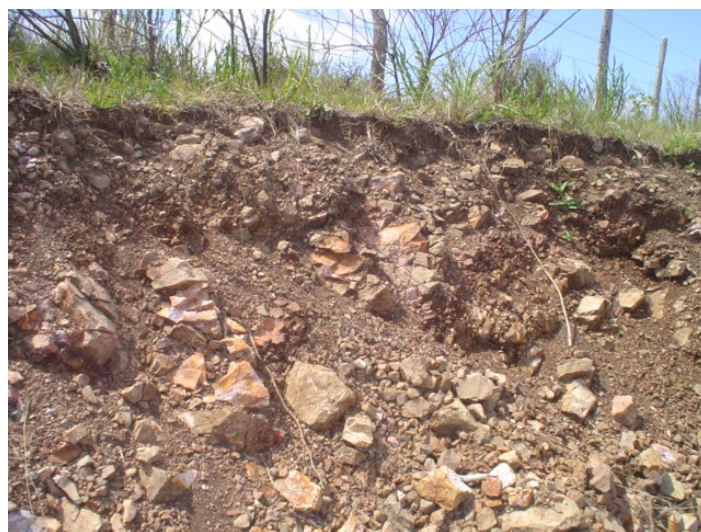
Fig.45. Solos rasos ao longo das superfícies de falhamentos, com predominância de calhaus silicosos altamente metamorfizados. Dominância de Neossolo Litólico Psamítico saprolítico .