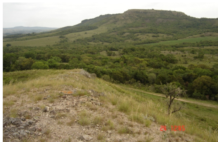
Fig.12. Falhamentos, vales, superfícies aplainadas, cerros e vegetação. As características dessas unidades de formas de relevo interagem com a vegetação.