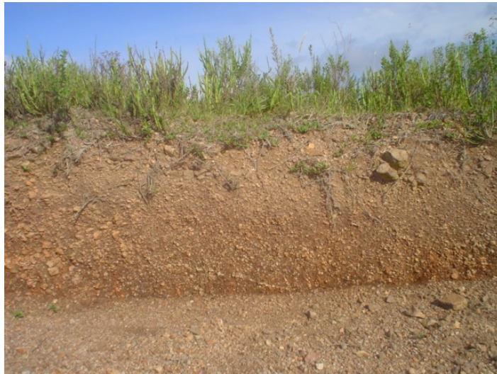
Fig.58. Neossolo Regolítico Distrófico cambissólico desenvolvido em granitos do complexo Dom Feliciano no terço superior de cerros rochosos.