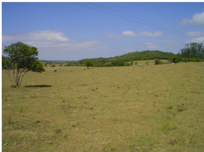
Fig. 26. Campos limpos da unidade Sg 0 nos limites com elevações rochosas isoladas que estão situadas como Unidade Srg.