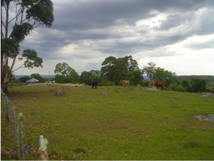
Fig.39. Pecuária familiar nas bordas das serras, com gramíneas nativas após o desmatamento generalizado do planalto.