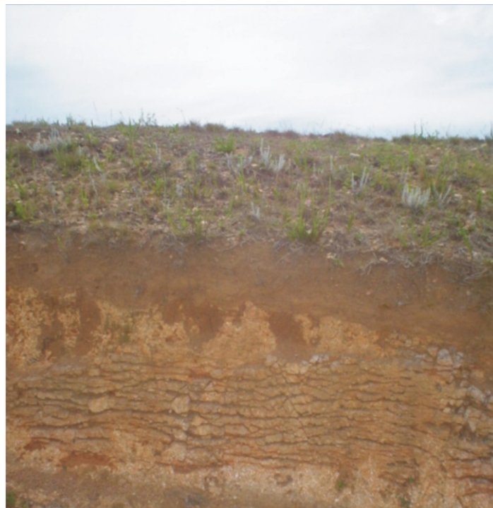
Fig. 24. solos rasos no planalto central, nas colinas aplainadas levemente mamilonares desenvolvidas de rochas graníticas metamorfizadas. Unidade Sg 0 - terras altas aplainadas.