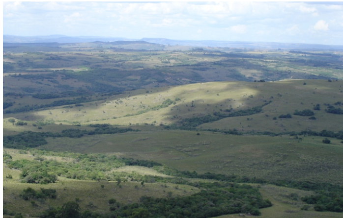
Fig.14. Formas de relevo aplainadas nas nascentes e divisores de águas. Planalto central constituído de rochas graníticas, com campos abertos de savana possivelmente constituída parcialmente pelo uso do fogo. As matas persistem ao longo dos drenos naturais.