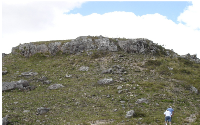
Fig.10. Depósitos sedimentares paleozóicos elevados. Constituem "inselbergs" isolados, situados sobre rochas cristalinas dos complexos graníticos que formam o planalto central do município.