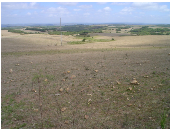
Fig. 25. Terras aplainadas do planalto central, no início das nascentes dos arroios. Culturas de inverno após colheita. Campos limpos com matas no terço inferior das encostas mais inclinadas. Declividade < 5%. Muitos solos são rasos e cascalhentos.