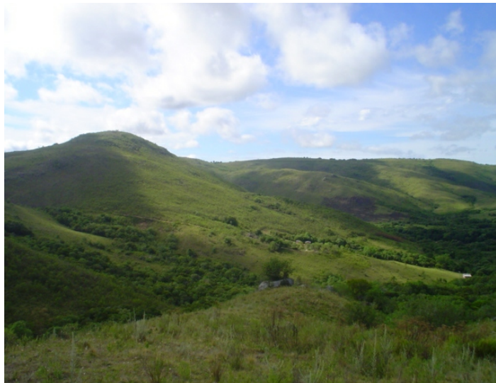
Fig.55. Local de transposição do rio Camaquã, cortando o maciço granítico, e caracterizando uma serra íngreme e rochosa pelo efeito erosivo natural de seu alto gradiente hidráulico.

"limpas", não se tornam favorecidas a atividades agrícolas convencionais. Há que se criar um sistema de uso da mata ainda existente, com um enriquecimento de espécies locais que possam dar retorno sem afugentar os animais silvestres.