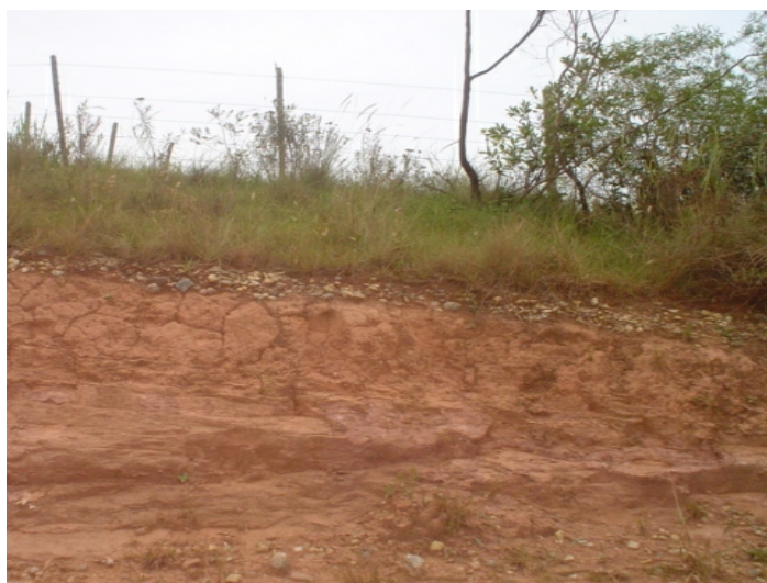
Fig. 37. Solos desenvolvidos de sedimentos paleozóicos finos, ultrametamorfizados, na borda do planalto. Estão cobertos por uma lâmina de sedimentos cascalhentos com seixos pertencentes à formação Porongos.