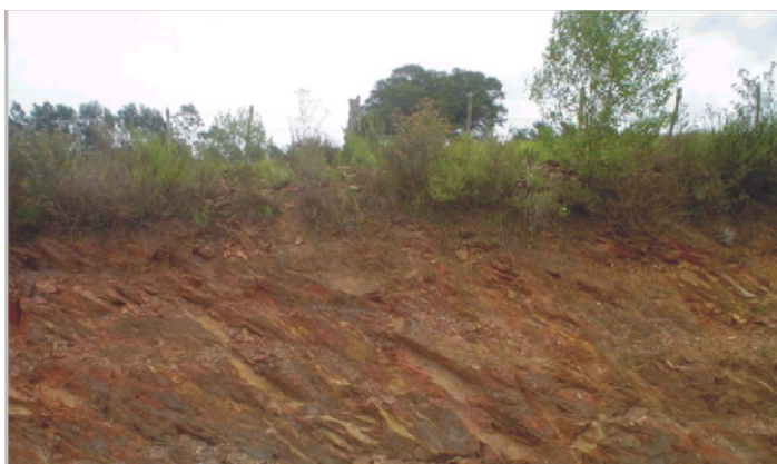
Fig.43. Neossolos Litólicos Distróficos saprolíticos sobre metassedimentos em superfícies residuais elevadas.

Essas terras, no geral, não têm aproveitamento agrícola. Entretanto, pela beleza dos contrastes altimétricos e pelas formas que contrastam com o relevo que se modela no planalto, em cotas inferiores, têm sido usadas, ao longo do tempo, como locais de moradias das antigas fazendas. São áreas de abrigo dos animais e talvez de futuras organizações de turismo. São restos geológicos de uma história pouco conhecida ou, se conhecida, pouco divulgada.