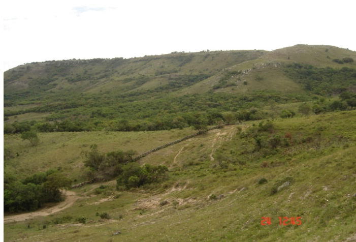
Fig.11. Os cerros, com coberturas sedimentares paleozóicas e mesozóicas, testemunhos de um passado geológico milenar, empolgam pela aspereza das bordas e pela lisura do seu platô. São pontos isolados no planalto.