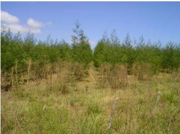
Fig.5. Plantações de acácia negra ( Acácia decursens ) que juntamente com pinus se constituem nas

principais espécies cultivadas, na proposição atual de florestar o município. Cobrem os campos independentemente da qualidade das terras. Substituem o gado nas antigas fazendas, muitas, hoje, com as sedes abandonadas.