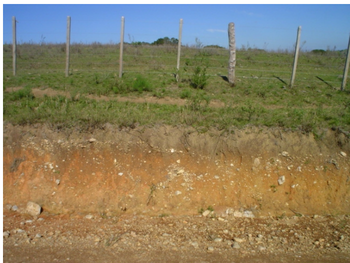
Fig. 23. Solos profundos no planalto central nos divisores de água das sub-bacias hidrográficas. Unidade Sg 0 - terras altas aplainadas.

Pelo sistema proposto pela Embrapa (1999), estão situados como Luvissolos Hipocrômicos Órticos chernossólicos (Fig. 28). Trata-se de antigos chernossolos que foram superficialmente degradados pelo tempo. Quanto ao uso agrícola estas terras aplainadas são próprias a uma agricultura desenvolvida. O relevo pouco inclinado da maior parte das encostas (2-5%) e uma maior continuidade das superfícies favoráveis ao uso agrícola de forma mecanizável proporciona maior aproveitamento relativo das áreas. Constituem as terras que podem produzir grãos de uma forma generalizada no município. São aptas também a uma agricultura familiar com limitações inerentes a elevada acidez e falta de fósforo. É de se estimar que, mesmo caracterizada como área própria ao uso generalizado de atividades agrícolas, o aproveitamento das superfícies mecanizáveis, não são comparáveis com o Planalto Sul-Rio-Grandense onde as glebas são contínuas. Rochosidade, pedregosidade e partes depressivas com solos hidromórficos são áreas excludentes não caracterizadas na proposta dos mapas.