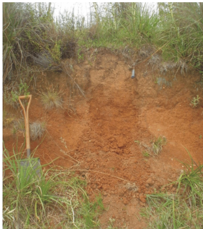
Fig. 21. Solos profundos desenvolvidos de rochas sedimentares antigas. Formações Palermo e Rio Bonito que se situam onde os processos erosivos ainda não expõem os granitos.