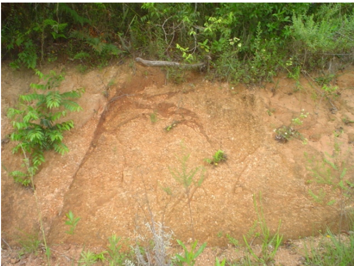
Fig.41. Neossolo Litólico Distrófico típico que ocorre na borda das serras no complexo granítico Dom Feliciano.