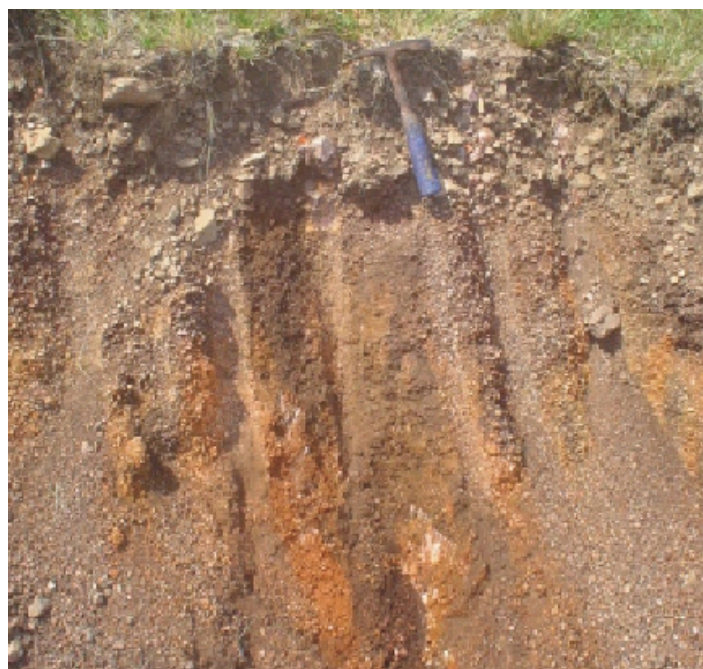
Fig.54. Cambissolo Háplico Ta Distrófico glóssico que ocorre nos vales próximos a falhas geológicas, constituindo mantos de cascalhos na superfície.