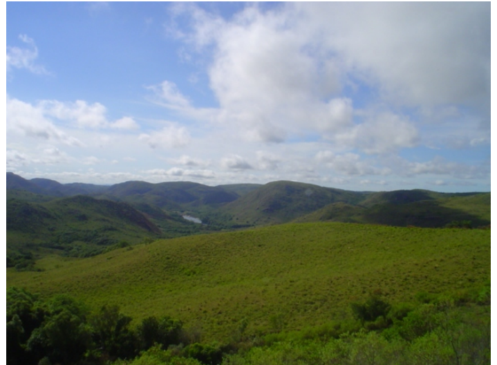
Fig.8. Vale profundo e marcante do rio Camaquã, estabelecido ao longo do tempo. Corta o planalto formado por vários complexos de rochas cristalinas entrecortadas entre si por fraturas, suturas, falhamentos, etc.

Esse rio comanda uma drenagem de padrão dentrítico e subdentrítico. Seus principais afluentes pela margem esquerda direcionam-se, marcadamente, para o sul (arroios dos Nobres, das Pedras, dos Vargas). Os da margem direita, geralmente, são mais extensos, e apresentam padrão de drenagem dentrítico subparalelo.