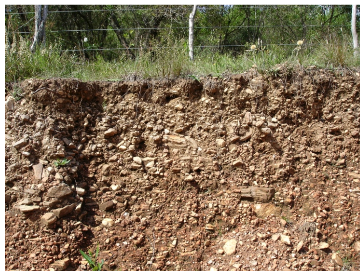
Fig.48. Neossolo Litólico Distrófico saprólítico de ocorrência dos topos das colinas sobre rochas metamorfizadas.