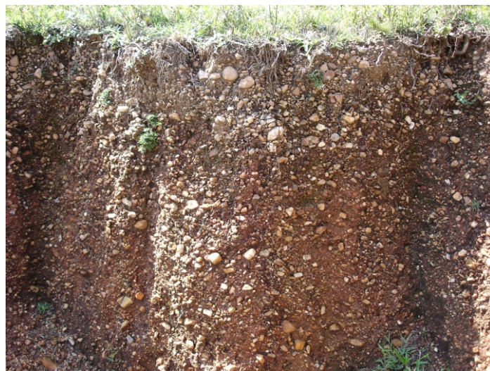
Fig.16. Neossolo Flúvico Distrófico saprolítico constituído em terraços fluviais de origem provavelmente terciária, nas bordas do rio Camaquã, próximo à fossa tectônica no seu limite com o planalto.

São terras próprias às atividades agrícolas com limitações que podem ser corrigidas com insumos de calcário e fósforo. Não há impedimentos a