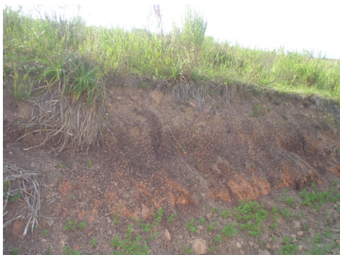
Fig.52. Horizonte escuro na parte superior do Bi, com característica de "horizonte sômbrio" descrito na Soil Toxonomy, 1975. Sua constituição é atribuído a um clima úmido passado.