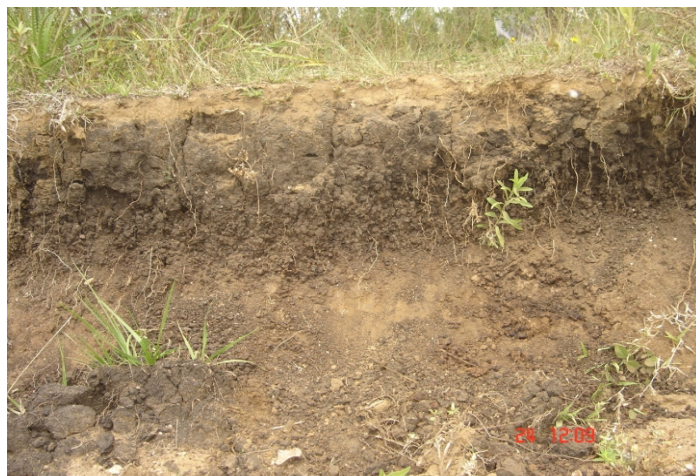
Fig. 28. Luvissolo Hipocrômico Órtico chernossólico desenvolvido em dioritos ou tonalitos que pela alta meteorização superficial não cumprem a caracterização dos chernossolos (falta de estrutura e baixa saturação de bases no horizonte A). Ocorrência restrita no planalto na região do complexo Arroio dos Ratos.