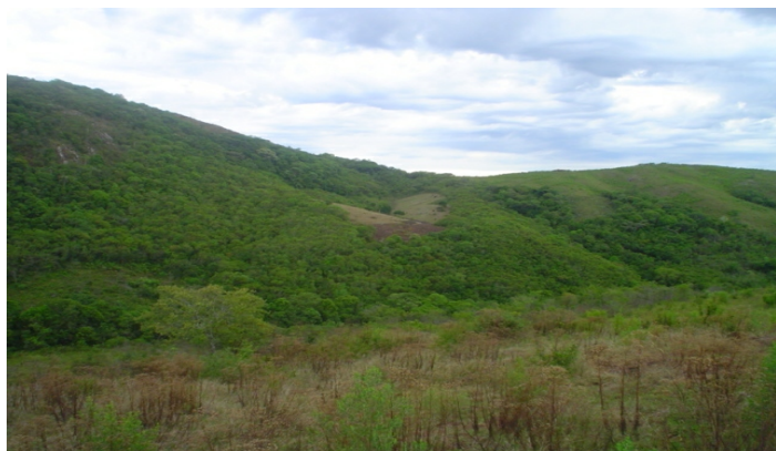
Fig.56. Borda das serras rochosas no contato com as partes depressivas com vegetação secundária arbustiva. Nessas superfícies rochosas e íngremes, há pequenos produtores que ainda cultivam a terra em pequenas roças.