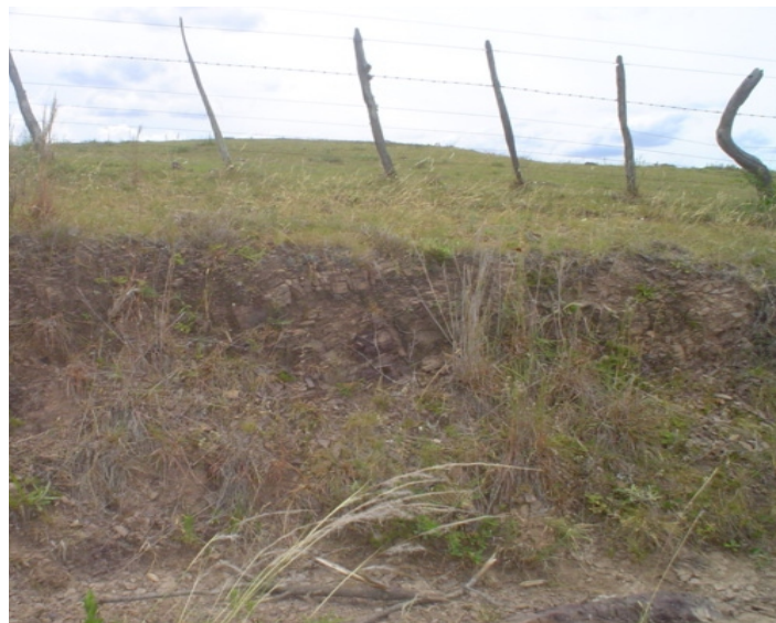
Fig. 34. Neossolo Litólico Distrófico húmico (léptico) desenvolvido em metapelitos da formação Arroio dos Nobres. Solos muito rasos com aproveitamento em pastagens nativas.