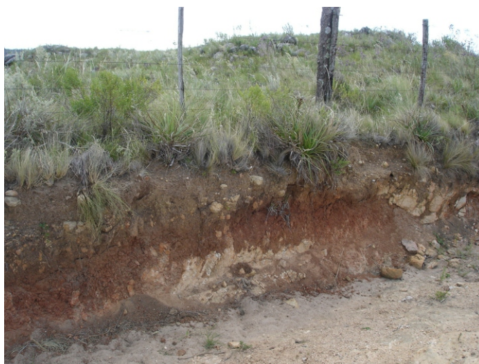
Fig. 32. Solos rasos no planalto com calhaus e alguma rochacidade nas bordas das sub-bacias hidrográficas de declives mais acentuados nas terras aplainadas. Unidade Sg 1 .