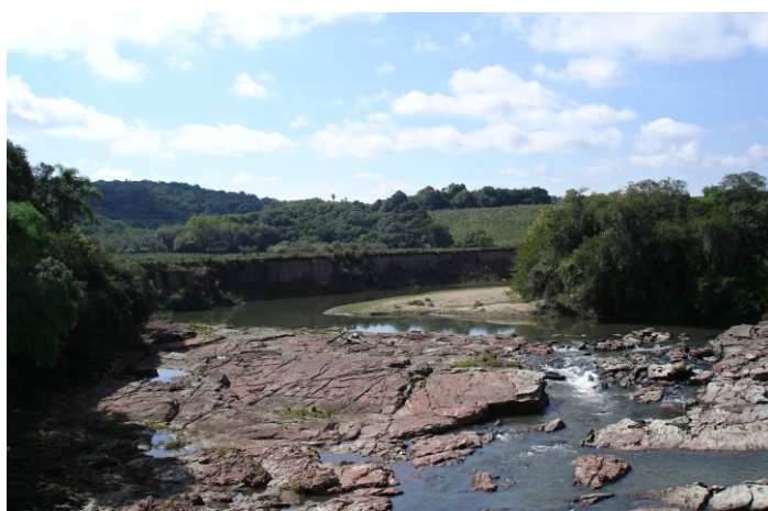
Fig.15. Arroios que compõem as sub-bacias hidrográficas do rio Camaquã, cortando sedimentos paleozóicos e mesozóicos. Na "Serra das Encantadas" possuem altas cargas hidráulicas, ainda não exploradas como fonte de água ou energia, para uso local.