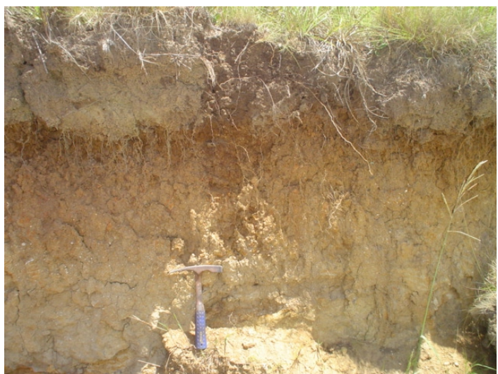
Fig.30. Chernossolo Argilúvico Órtico abrupto que ocorre nas rochas enriquecidas de carbonatos no complexo metamórfico Várzea do Capivarita. Unidade Sg 1 .