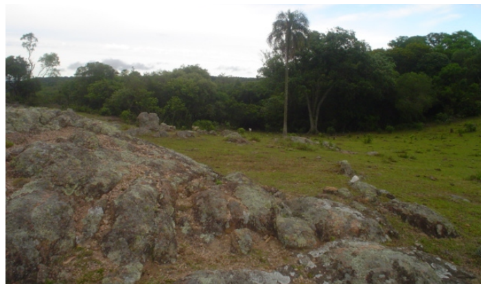
Fig.38. Topos aplainados dos morros de rochas graníticas da formação Dom Feliciano que ocorrem na borda do planalto.

Dentro das condições de uma agricultura convencional e regional as terras seriam da classe-VIse de capacidade de uso da terra e 5s(n) de aptidão agrícola . São terras destinadas a pastagens cultivadas ou nativas. Há restrições à qualidade das pastagens nativas. Podem ser cultivadas com árvores perenes (fruticultura), ou até mesmo florestamento. Nas glebas mais suscetíveis a erosão.