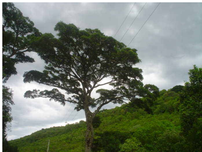
Fig.7. Árvores isoladas de grande porte, entre uma vegetação arbustiva. São restos de uma floresta que cobriam as bordas do planalto, onde se localizam as serras escarpadas.

antigos na área atestam que há mais de 50 anos os campos em geral eram mais "limpos". Havia menos grupos de arvoretas (microfanerófitas) e menores quantidade de vassourais (caméfitas), hoje em dia muito freqüentes.