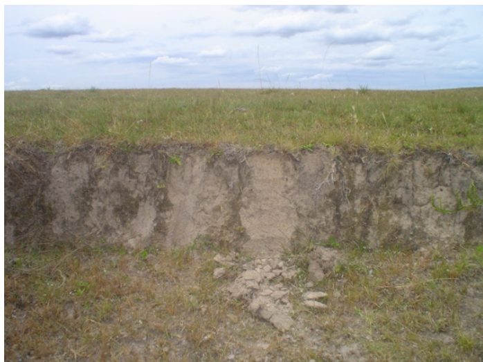
Fig. 33. Neossolo Litólico Eutrófico húmico desenvolvido em metapelitos com maior espessura no centro depressivo da formação Arroio dos Nobres. Uso em cultivos anuais e pastoreio.

A vegetação nas áreas deprimidas é de savanas. Quanto ao uso agrícola essas terras, no geral, são próprias a pastagens cultivadas ou nativas. Entretanto nos platôs residuais, com áreas menos significativas dentro do contexto, o solo embora muito intemperizado (muito ácido e com alumínio trocável), pode ser usado com cultivos anuais.