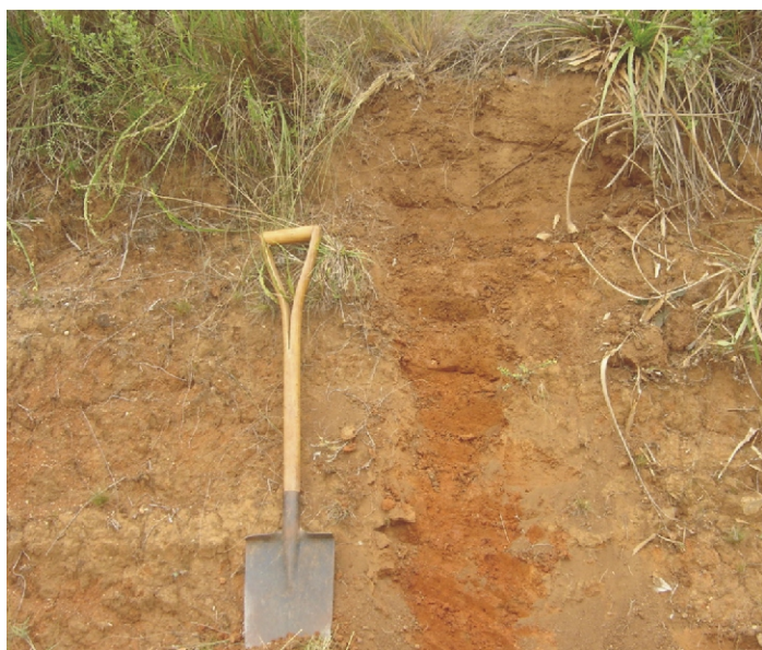
Fig.19. Argissolo Bruno-Acinzentado Eutrófico abruptico desenvolvido em superfícies sedimentares antigas do período Permiano da formação Palermo com vegetação campestre e aglomerações de butiazeiros ( Butia eiosphata ) nos vales mais úmidos.

A alta declividade de algumas encostas (15%), situadas entre outras de declives menores, com o uso mais intensivo, poderá, ocasionar sérios problemas de erosão, principalmente junto às vias de drenagem. Devido a este fator, a capacidade de uso a terra é da classe VI-se. São próprias para pastagens cultivadas, em virtude das limitações de suscetibilidade à erosão, alta acidez e baixos teores de fósforo. Cultivos ocasionais em áreas selecionadas podem ser alternados com cultivo de pastagens.