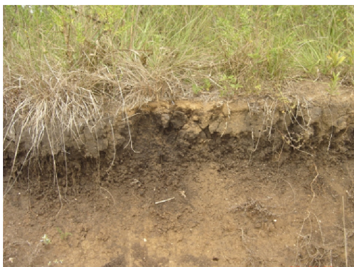
Fig. 29. Chernossolo Ebânico Órtico vértico que ocorre ocasionalmente nos aglomerados de rochas graníticas alcalinas do complexo metamórfico Várzea do Capivarita e Complexo Gnáissico Arroio dos Ratos. Unidade Sg 1 .

As áreas cultivadas quando separadas do contexto de sangas, afloramentos rochosos, depressões úmidas e matas ciliares, são da classe III-se de capacidade de uso que representa terras próprias a culturas anuais com restrições de suscetibilidade a erosão e de solos com carências de corretivos (fósforo e calcário). Entretanto as pequenas glebas isoladas entre os aspectos restritivos são de uso "favorável" a uma agricultura pouco desenvolvida.