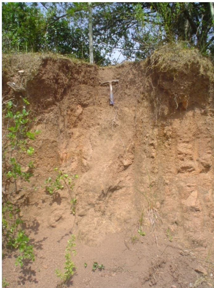
Fig. 31. Solos rasos coluviais desenvolvidos nos sopés dos vales. São Neossolos Regolíticos Eutróficos ou Distróficos saprolíticos . Unidade Sg 1 .