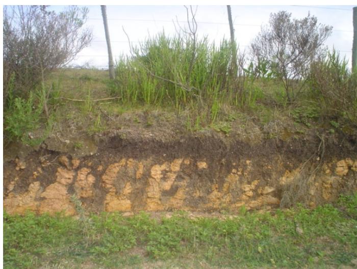
Fig.53. Cambissolo Húmico Eutrófico glóssico desenvolvido em topo de colina, aparentemente com desmatamento recente.