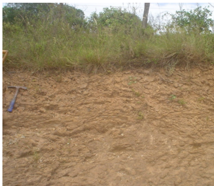
Fig.35. Rochas ultrametamorfizadas de sedimentos paleozóicos que cobrem o planalto e afloram na borda da "Serra das Encantadas". Estão associadas as ocorrências de Neossolo Litólico Distrófico léptico .