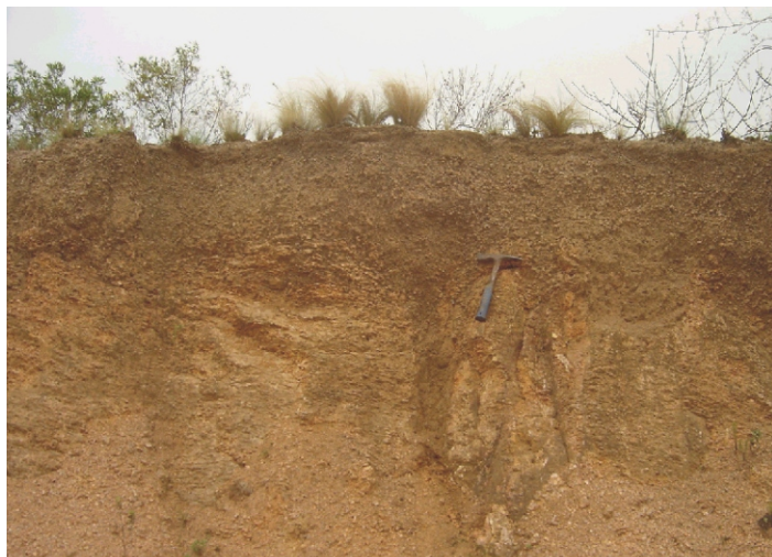
Fig.57. Neossolo Litólico Eutrófico típico nas regiões de serras rochosas desenvolvidas em granitos do complexo Dom Feliciano.