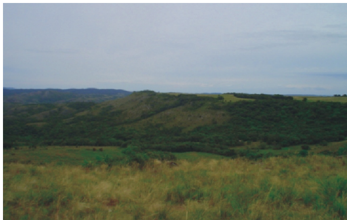
Fig.13. Borda do planalto central no contato com as serras desenvolvidas de metassedimentos na região depressiva do Sistema Dobrado Tijucas. Topos planos antes cultivados apresentam vegetação distinta das encostas com campos "sujos".