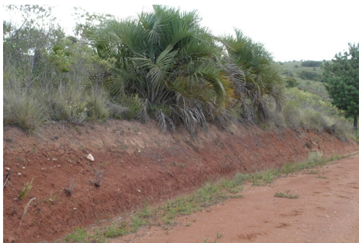
Fig.17. Argissolo Vermelho Eutrófico chernossólico com ocorrência nas superfícies de exposição mais modernas nas coxilhas onde há uma vegetação ocasional de butiazeiros ( Butia eiosphata ).