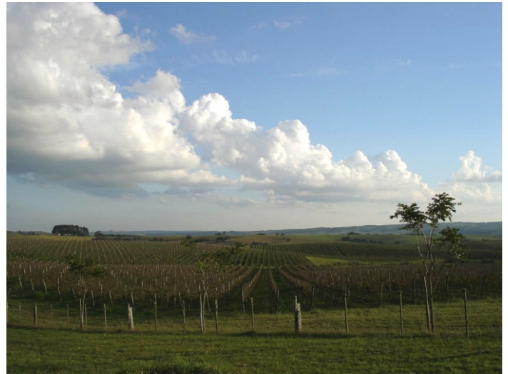
Fig.1. Parreirais que se estendem atualmente nos campos aplainados, onde a pecuária, há mais de dois séculos, é a principal atividade rural.