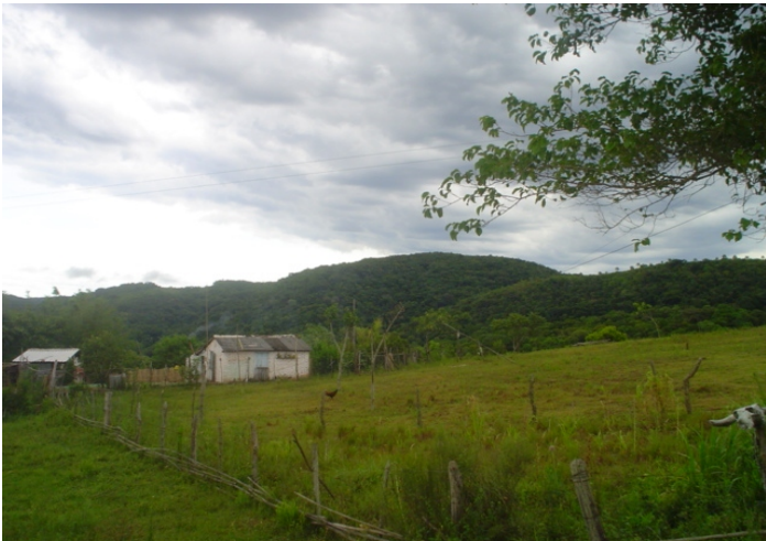
Fig.4. Pequeno produtor agrícola nas serras da região de rochas cristalinas. Local de uma região muito pobre em relação a existência de terras cultiváveis.