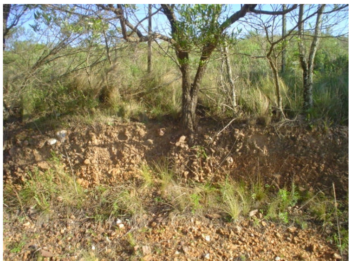
Fig.50. Neossolo Regolítico Distrófico saprolítico de ocorrência generalizada na "Serra das Encantadas" sobre a formação Porongos. Vegetação de savana que lembra o cerrado do Brasil Central. Manto cascalento com calhaus.