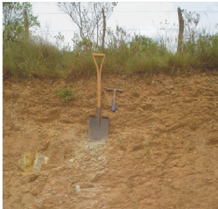
Fig.44. Neossolo Litólico Distrófico saprolítico sobre metassedimentos na borda da "Serra das Encantadas".