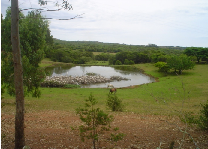
Fig.3. pequeno açude na parte central do município. Durante o período de verão, muito seco (2005), se apresenta como último refúgio (único na época) para aves silvestres na região.