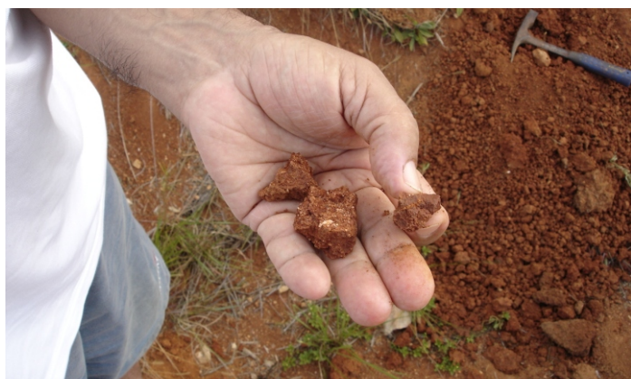
Fig. 22. Argissolo Vermelho Distrófico abruptico com estruturas em blocos angulares e subangulares moderada a fraca, com minerais incompletamente intemperizados nos horizontes inferiores.