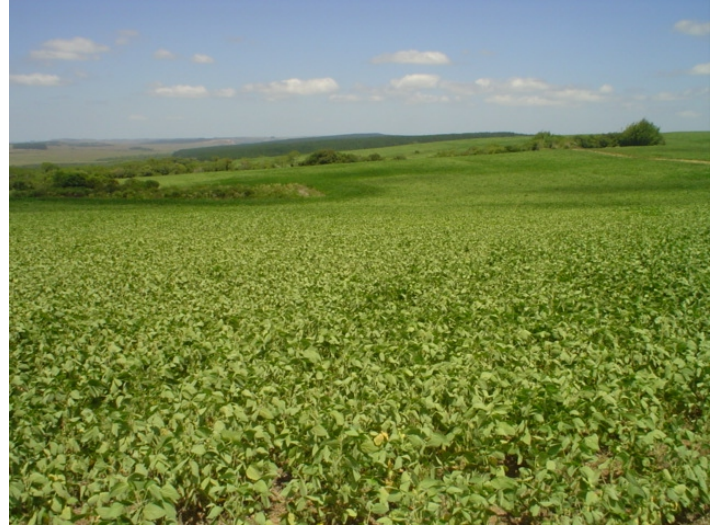
Fig.6. Cultura de soja no planalto central nas terras altas aplainadas, próprias a cultivos anuais. Unidade Sg 0 .

principais espécies cultivadas, na proposição atual de florestar o município. Cobrem os campos independentemente da qualidade das terras. Substituem o gado nas antigas fazendas, muitas, hoje, com as sedes abandonadas.