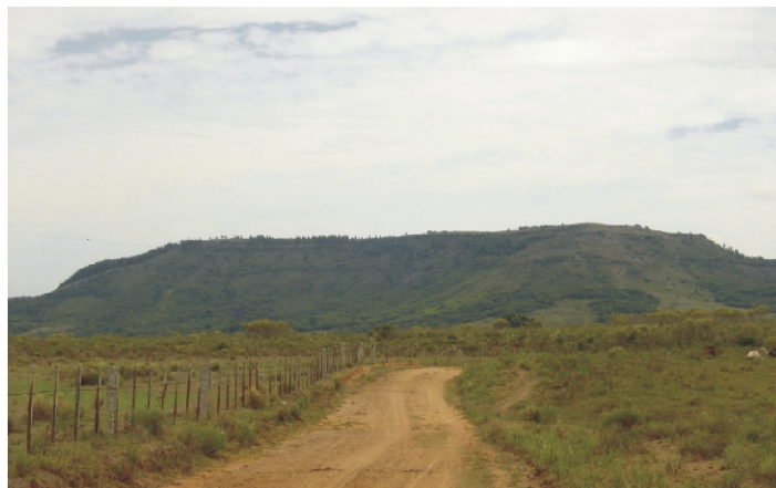
Fig.20. Terras em superfícies aplainadas e intermitentes desenvolvidas em rochas sedimentares antigas formações Palermo e Rio Bonito, que ainda cobrem as rochas graníticas nas bordas do Cerro Partido, formação sedimentar paleozóica e mesozóica.