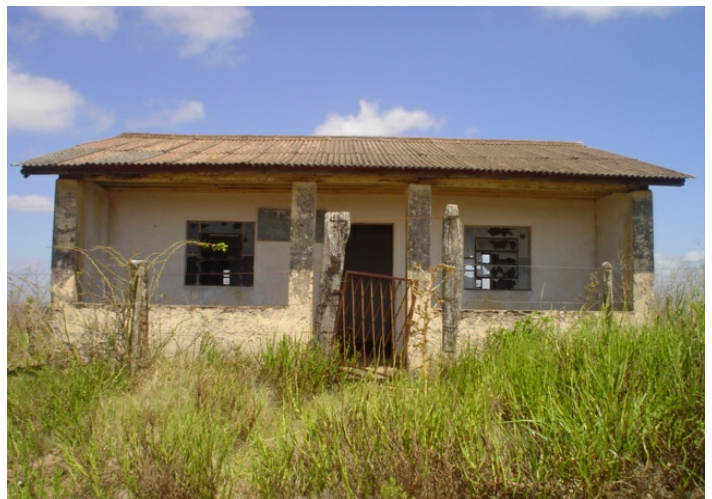
Fig.2. Escolas abandonadas no campo fazem parte de uma nova cultura que remove o camponês do seu meio de aprendizagem. O fator econômico atualmente se justifica por si, onde não se medem as perdas sociais.