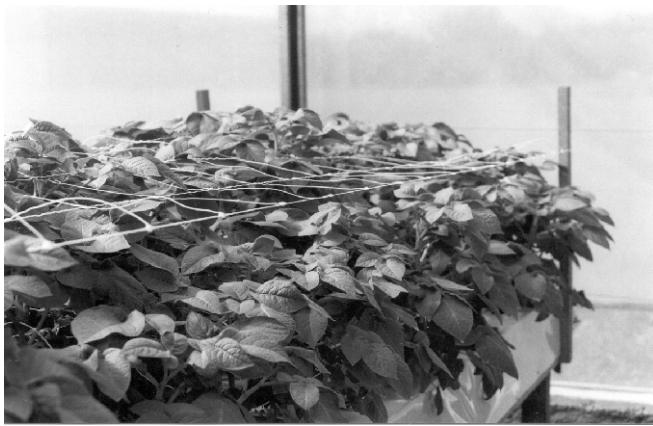
Figura 5. Tutoramento com rede.