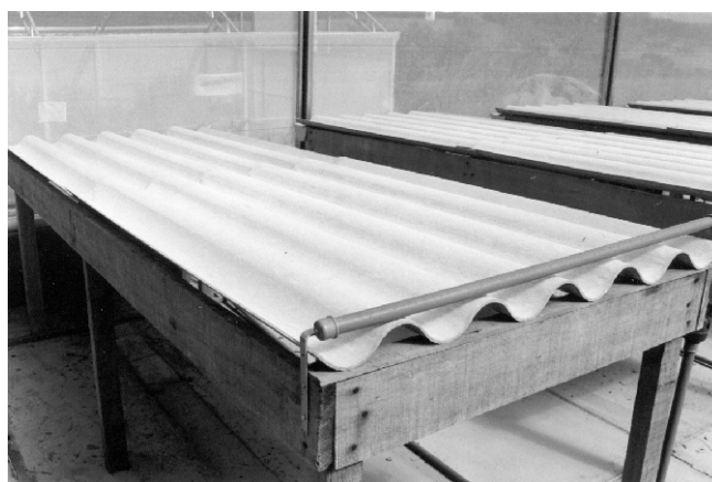
Figura 1. Plataforma em telha de fibrocimento.

O sistema baseia-se em uma plataforma constituída de telhas de fibrocimento, assentadas sobre suportes de madeira (basicamente esteios cravados no solo, ligados por caibros ou longarinas), que conferem à estrutura uma declividade de 4% (Figura 1). As telhas com largura padrão de 1,10 cm, e comprimento adequado a estrutura a ser montada, apresentam canais de 6 cm de altura e espaçados de 18 cm (distância entre dois pontos médios).