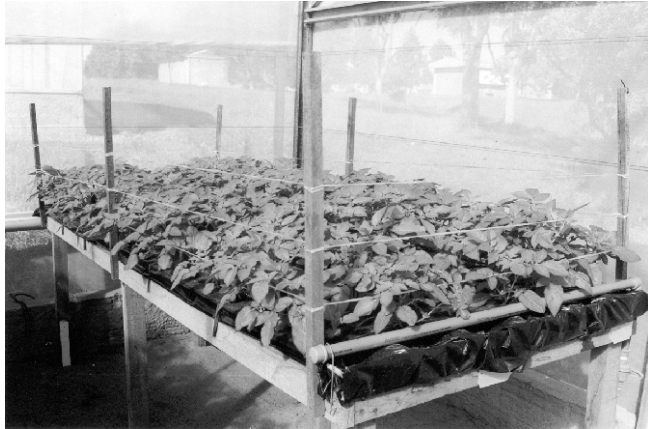
Figura 4. Tutoramento com fio de ráfia.