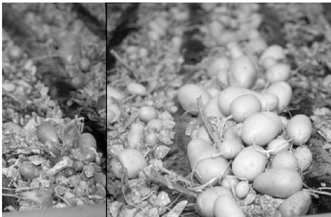
Figura 6. Tubérculos durante a colheita.