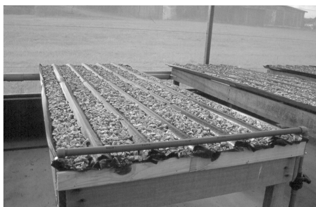
Figura 2. Telha de fibrocimento recoberta com filme de polietileno, e com camada de brita preenchendo parcialmente os canais.

Os canais da telha são revestidos com um filme de polietileno, cuja espessura não deve ser inferior a 150 micra, o que objetiva prevenir qualquer reação indesejável dos nutrientes da solução com o material constitutivo da telha, além de evitar seu encharcamento. Uma camada de granito fragmentado (brita) de tamanho médio, preenche parcialmente os canais da telha, auxiliando na sustentação das plantas (Figura 2).