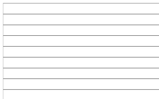
Figura 3. Classificação de tubérculos de batata cultivados em sistema hidropônico, quanto ao tamanho, em percentagem do total colhido, Pelotas, Embrapa Clima Temperado, 2001.

Médias seguidas da mesma letra na coluna não diferem estatisticamente pelo teste de Duncan ( P < 0.05 ).