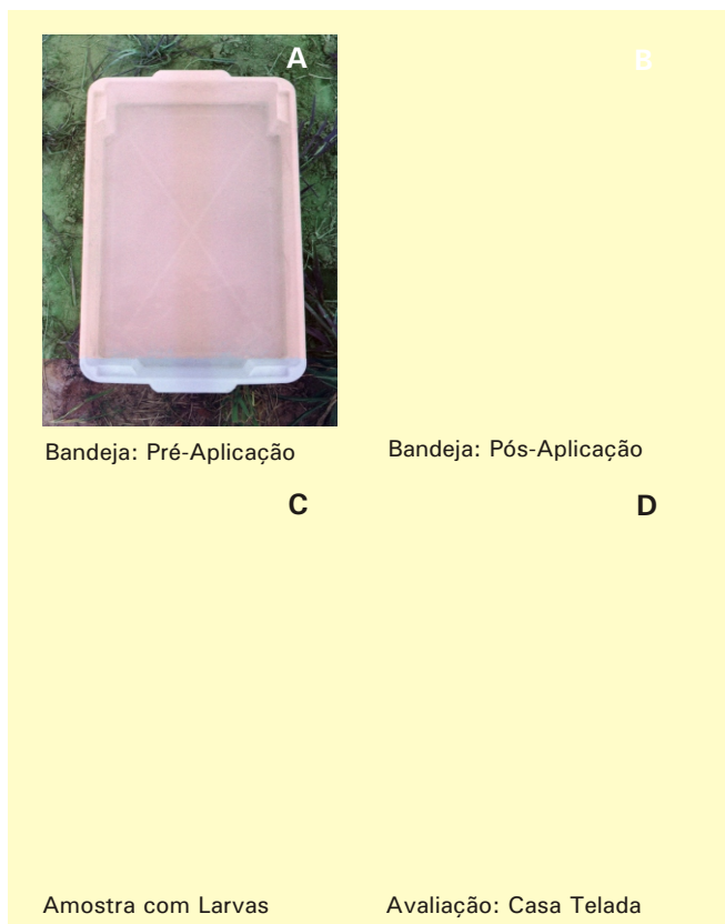
Figura 2. Métodos e disposição de materiais, no arrozal e casa telada, utilizados na aferição da deriva de carbofuran G. Pelotas, RS. 2002.