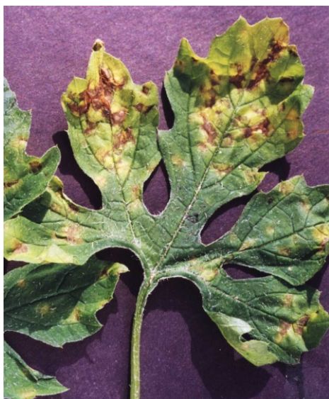
Fig. 14. Folha de melão-de-são-caetano atacada por Pseudoperonospora cubensis .