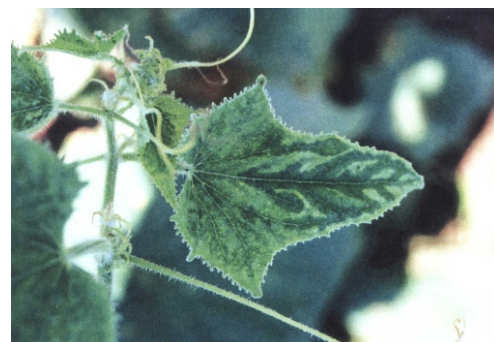
Fig. 24 Folha de pepino mostrando sintoma de faixa verde das nervuras e deformação foliar.