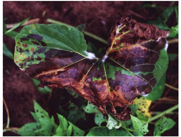
Fig. 4. Queima causada por Rhizoctonia solani em folha de abóbora.