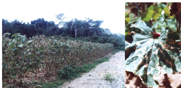
Fig. 15. Mancha-de-Leandria ( Leandria momordicae ) em pepino: aspecto geral do ataque na cultura e folha com manchas esbranquiçadas.