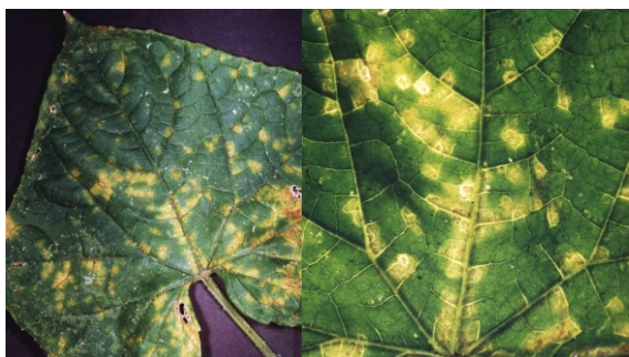
Fig. 13. Manchas amarelas e angulares em folha de pepino causadas por Pseudoperonospora cubensis .