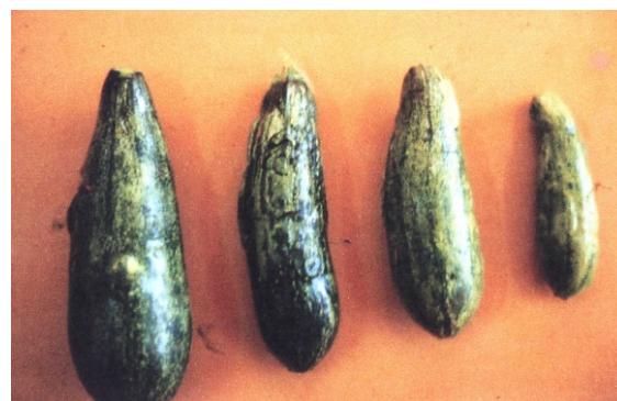
Fig. 22. Frutos de abobrinha italiana naturalmente infectados com PRSV-W (nos frutos, sintomas de mosaico, bolhas e deformação).