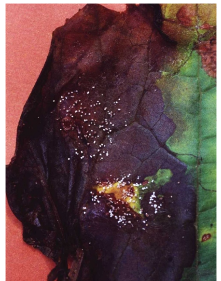
Fig. 5. Escleródios de Rhizoctonia solani sobre folha de abóbora.