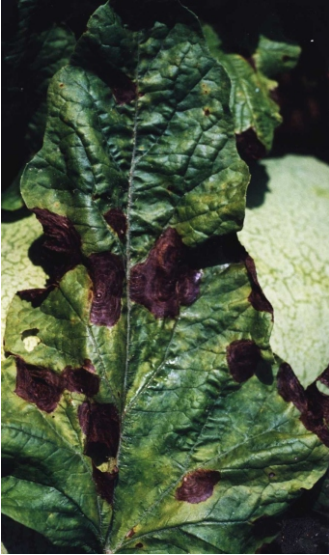
Fig. 7. Manchas concêntricas em folha de melancia ( Corynespora cassiicola ).