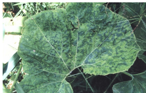
Fig. 23. Folha de abóbora de moita mostrando sintoma de mosaico.