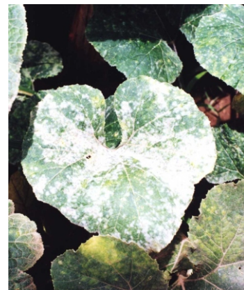
Fig. 12. Manchas típicas de oídio ( Erysiphe cichoracearum ) em abóbora.