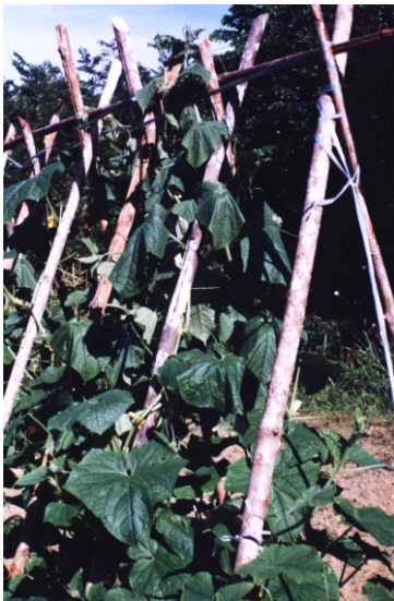
Fig. 19. Murchamento inicial descendente em pepino por Ralstonia solanacearum .