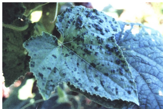
Fig. 21. Folha de pepino mostrando sintomas de bolhas verdes nas folhas.