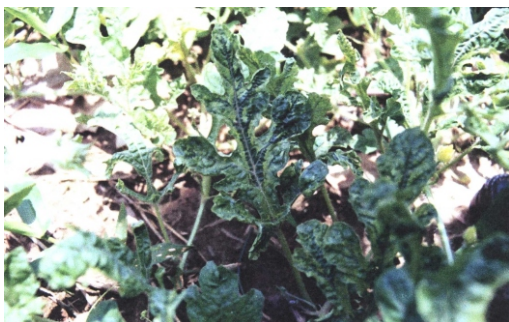
Fig. 20. Planta de melancia mostrando sintomas de mosaico severo, faixa verde das nervuras e deformação foliar.