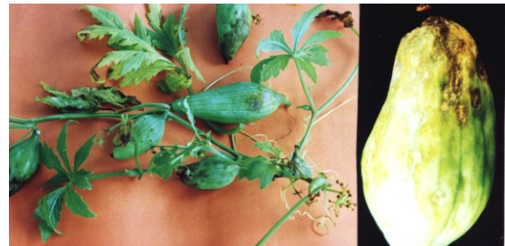
Fig. 11. Ataque em folhas, hastes, pecíolos e frutos de maxixe-peruano ( Colletotrichum gloeosporioides f. sp. Cucurbitae ).