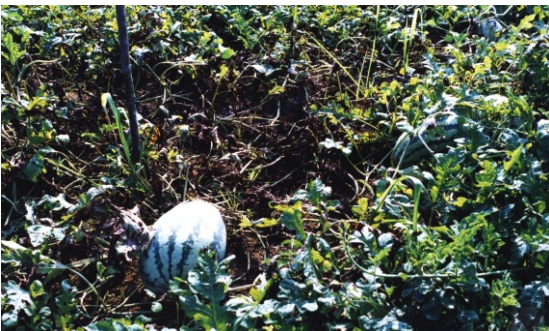
Fig. 9. Queima generalizada em melancia por C. cassiicola e R. solani associados.