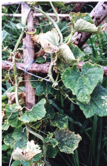
Fig. 2. Ressecamento por Rhizoctonia solani em folhas de pepino.