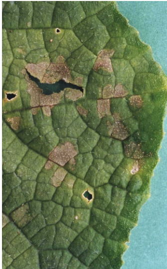
Fig. 1. Mancha cinzentas de Rhizoctonia solani em folhas de pepino.