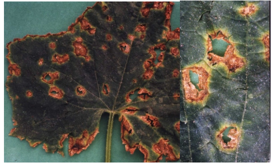
Fig. 10. Manchas foliares com secamento do centro e perfuração em pepino ( Colletotrichum gloeosporioides f.sp. Cucurbitae ).