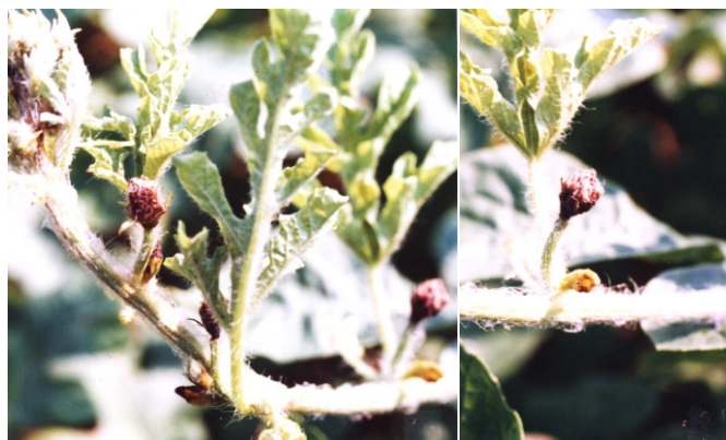
Fig. 16. Podridão das flores em melancia por Choanephora cucurbitarum .