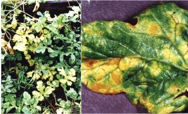
Fig. 18. Sintomas de mancha-bacteriana ( Xanthomonas campestris pv. cucurbitae ) em maxixe: folhagem com manchas amarelas que se estendem provocando amarelecimento generalizado (à esquerda); folha com manchas amarelas, às vezes oleosas translúcidas (à direita).

sucessivamente na mesma área ou intercalado com as solanáceas, hospedeiras da bactéria. A eliminação de plantas doentes do cultivo, logo no início, colocando-se cal virgem no local, pode retardar a disseminação da bactéria. Como o processo natural de infecção é por ferimentos, deve-se evitar ferimentos durante os tratamentos culturais e controlar nematóides-das-galhas (provocam ferimentos nas raízes).