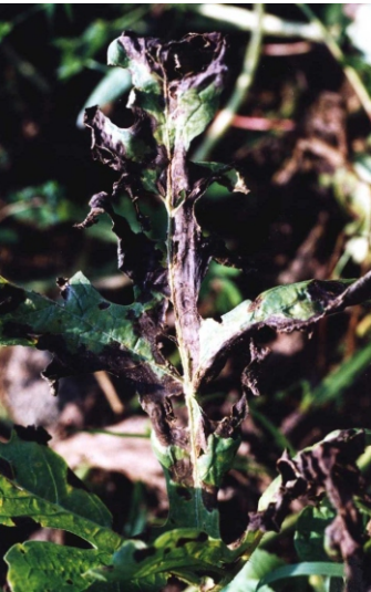
Fig. 8. Queima em folha de melancia causada por Corynespora cassiicola : associado com Rhizoctonia solani .