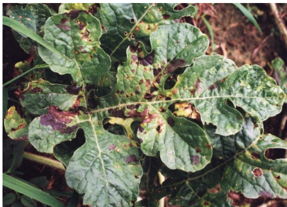
Fig. 3. Manchas causadas por Rhizoctonia solani em folha de melancia.