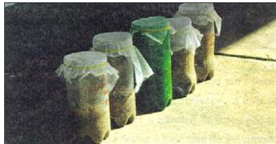
FIG. 2. Garrafas com substrato nas quais foi possível observar as larvas.

Avaliou-se o prejuízo através do número de frutos broqueados, determinando a intensidade de infestação e as perdas. A intensidade de infestação foi considerada a razão entre número de frutos broqueados pelo número total de frutos colhidos, multiplicada por 100.