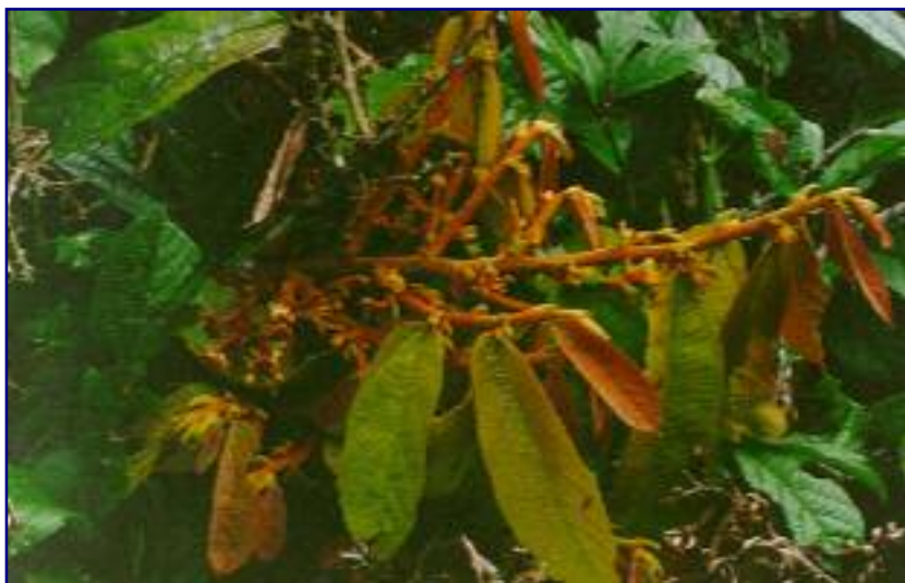
FIG. 2. Vassoura verde