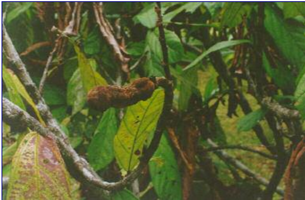
FIG. 4. Fruto tipo cenoura, com o crescimento paralisado.