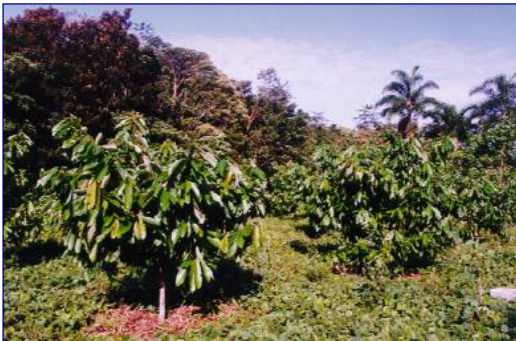
FIG. 5. Cupuaçuzeiro com cinco anos de idade, na área experimental do Embrapa Amazônia Ocidental submetido a poda fitossanitária desde o plantio da muda no campo.