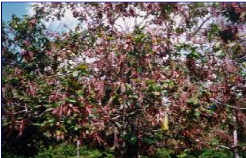
FIG. 1. Cupuaçuzeiro em área de produtor com alta incidência de vassoura-de-bruxa