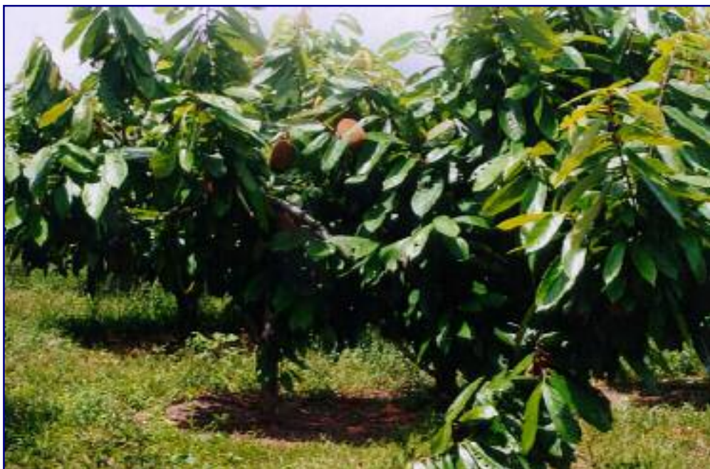
FIG. 8. Cupuaçuzeiro em área de produtor, aos oito meses após recepta da copa e submetido a poda fitossanitária.