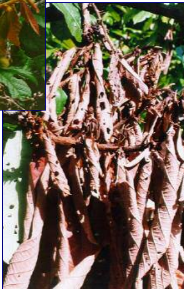
FIG. 3. Vassoura seca