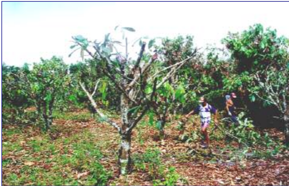
FIG. 7. Cupuaçuzeiro submetido a recepta da copa.