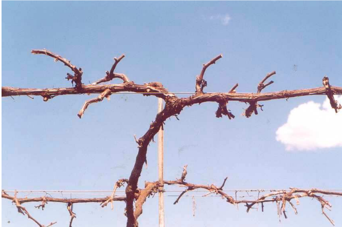
Fig. 5 – Plantas submetidas à poda curta, para formação de ramos.