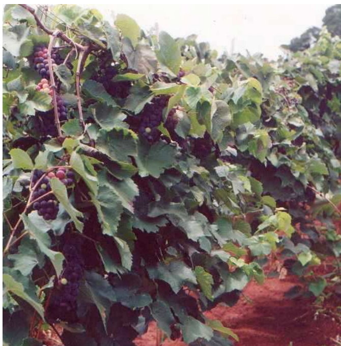
Fig. 8 – Plantas em produção, submetidas à poda longa (Foto: J. D. G. Maia).