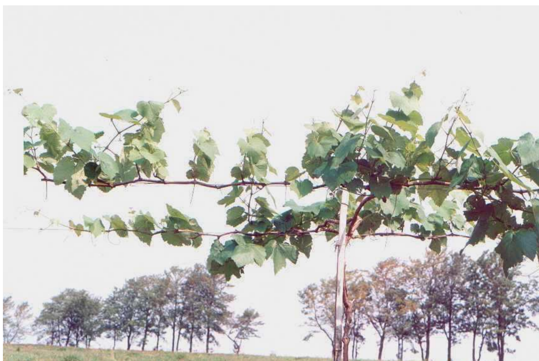
Fig. 4 – Fase final de formação da planta.