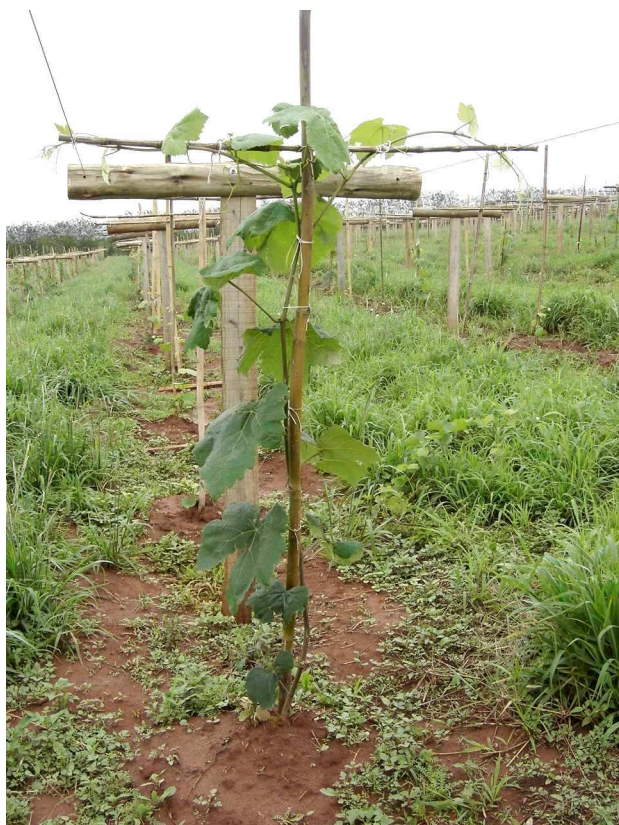
Fig. 3 – Fase inicial de formação da planta.