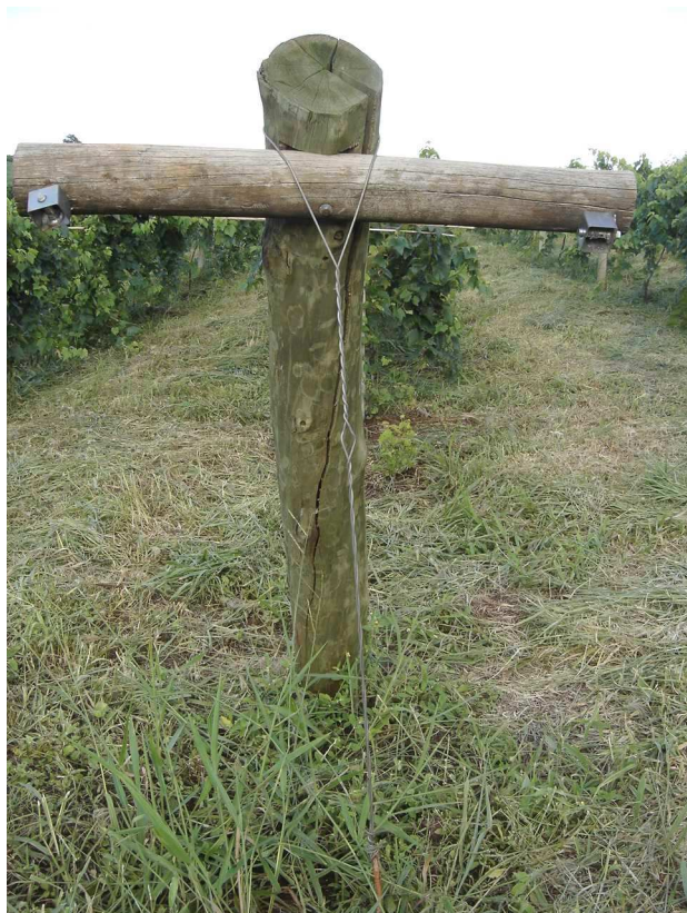
Fig. 2 – Fixação dos arames no final da linha (Foto: J. D. G. Maia).

Os arames de sustentação devem ser bem esticados nos finais de linha visando manter a vegetação até o nível de 1,80 m do solo, caso contrário pode ocorrer o embarrigamento, devido ao peso das cortinas. Para manter os arames no nível de 1,80 m do solo pode-se fazer o uso de escoras de madeira ou de bambu gigante, posicionado-as na metade do espaçamento entre plantas.