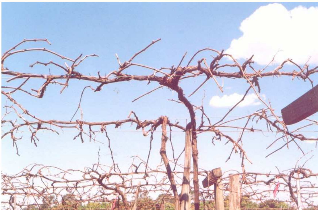
Fig. 6 – Plantas submetidas à poda longa, para produção (Foto: J. D. G. Maia).