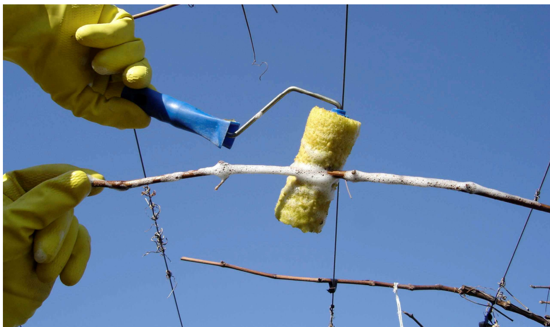
Fig. 7 – Rolo de espuma para aplicação de Dormex.

No verão, quando as temperaturas mínimas são superiores a 18°C, as podas devem ser realizadas cerca de 12 dias após a aplicação do etefom, seguido imediatamente da aplicação do Dormex®, em concentrações de 3 a 4%. No período mais frio, o etefom pode demorar até 45 dias para promover a desfolha, e neste período, se as temperaturas mínimas estiverem entre 13 a 17°C a concentração do Dormex® deve ser aumentada para 5,5 a 6,5%. O estágio ideal para realizar as podas é quando a desfolha atingir índices acima de 95% e as gemas estiverem inchadas, antes do ponto de 'algodão'. Na Região Sudeste, para os meses mais frios (maio, junho e julho) as podas devem ser realizadas imediatamente após a saída da massa polar, quando houver sinais de brotação nas extremidades das varas, gemas com ponta verde. Com a aplicação do etefom antes da poda, ainda no verão, o excelente resultado na brotação e desenvolvimento dos brotos pode