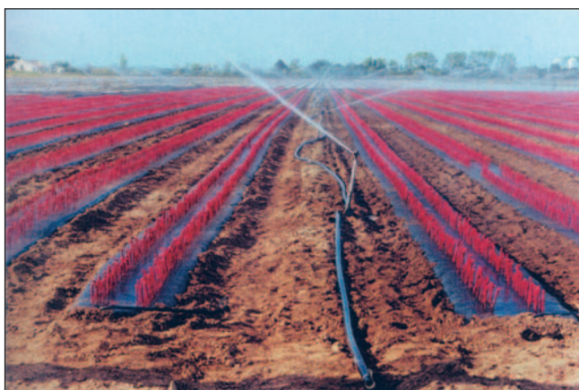
Fig. 15. Irrigação do viveiro por aspersão.