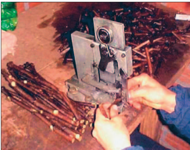
Fig. 3. Máquina de enxertia tipo ômega mostrando a primeira operação da enxertia: colocação do garfo (enxerto) para o corte.