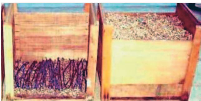
Fig. 5. Forçagem dos enxertos em caixas com serragem; Acondicionamento dos enxertos em camadas na caixa (esquerda) e caixa cheia (direita).