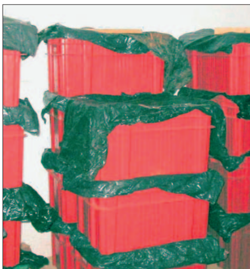
Fig. 7. Conservação em câmara fria das caixas com enxertos, aguardando o momento da forçagem na câmara quente.