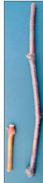
Fig. 2. Tamanho da estaca do porta-enxerto (direita) e do garfo da copa (esquerda) para enxertia de mesa.