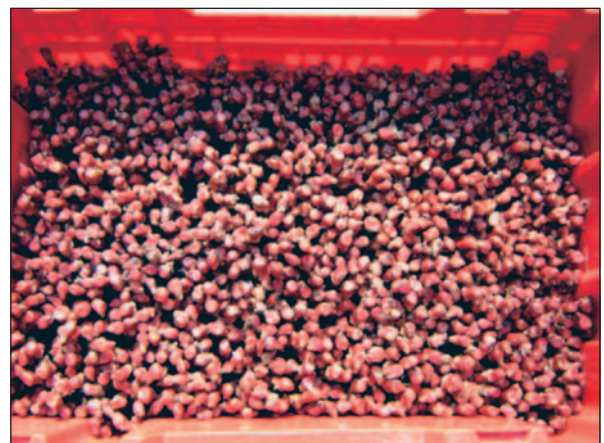
Fig. 6. Forçagem dos enxertos em caixa plástica com água no fundo. Acondicionamento dos enxertos na caixa.