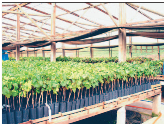
Fig. 11. Plantio do enxerto em saco plástico sob estufa com cobertura plástica (Foto: Gilmar B. Kuhn).