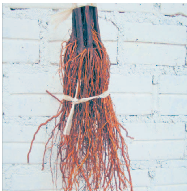
Fig. 19. Mudanças mostrando o sistema radicular lavado e bem formado (Foto: Gilmar B. Kuhn).