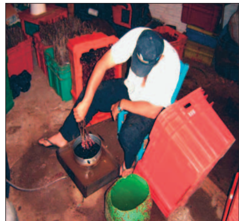
Fig. 4. Banho de cera após a operação de enxertia.