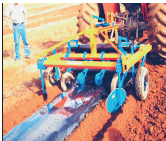
Fig. 14. Colocação do plástico no canteiro. Máquina acoplada ao trator que estende, tapa as bordas e perfura o plástico numa única operação.