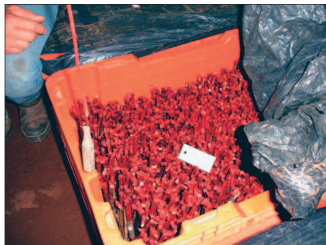
Fig. 8. Enxertos na câmara quente. Retirada do plástico para observar a formação do calo durante a forçagem.