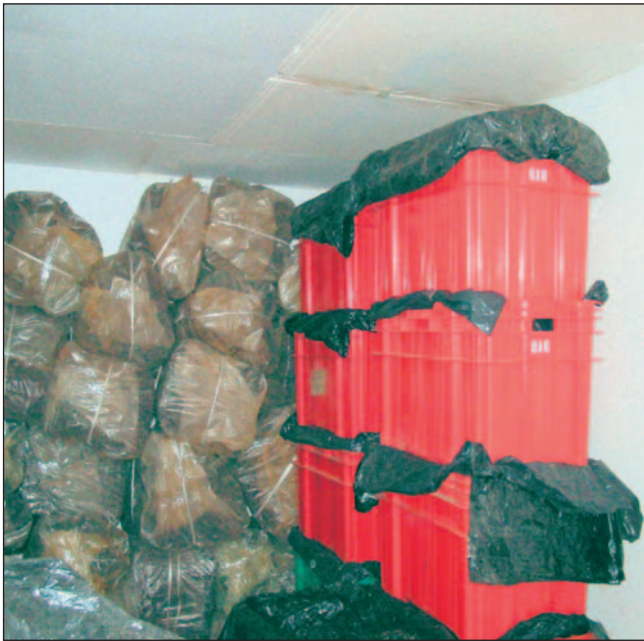
Fig. 1. Conservação de material vegetativo em câmara fria sem controle de umidade em pacote ou caixa, vedado com filme plástico.