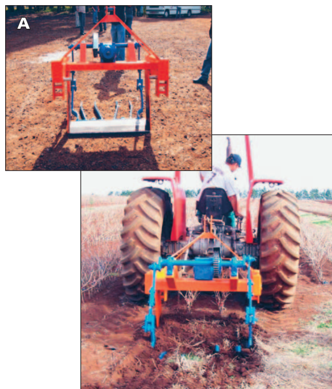
Fig. 18. Máquina para arrancar mudas no viveiro. A - Detalhe da máquina vista de frente (Foto: Gilmar B. Kuhn).