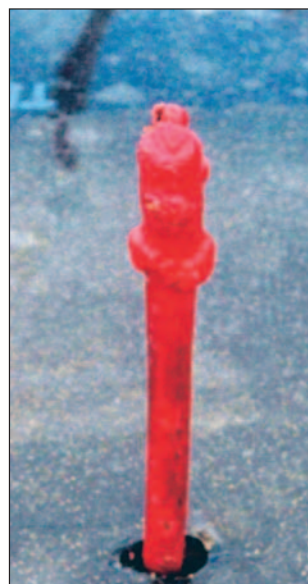
Fig. 10. Enxerto plantado no viveiro. Toda a parte exposta ao sol deve ficar protegida pela cera.