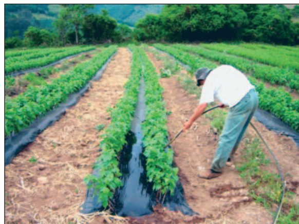
Fig. 16. Irrigação do viveiro de modo manual.