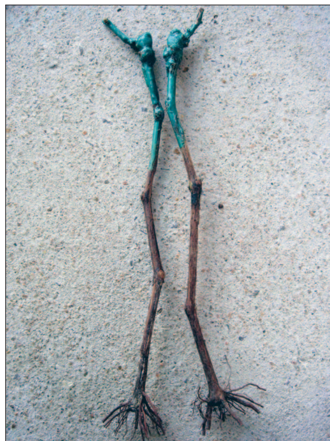
Fig. 20. Mudanças preparadas para o plantio. Ramo podado, deixando-se apenas duas gemas e raízes com \pm 10 cm de comprimento.