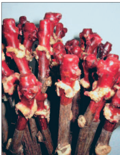
Fig. 9. Término da forçagem na câmara quente. Enxertos mostrando o calo formado no local dos cortes da enxertia.