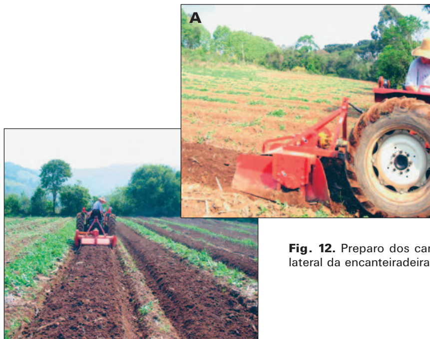
Fig. 12. Preparo dos canteiros. A - Detalhe da lateral da encanteiradeira.