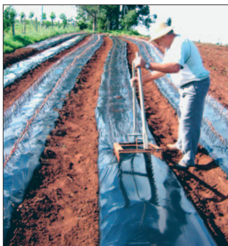
Fig. 13. Perfuração manual da lona plástica: Uso de suporte de madeira com pinos colocados de acordo com o espaçamento do plantio nas duas filas do canteiro.