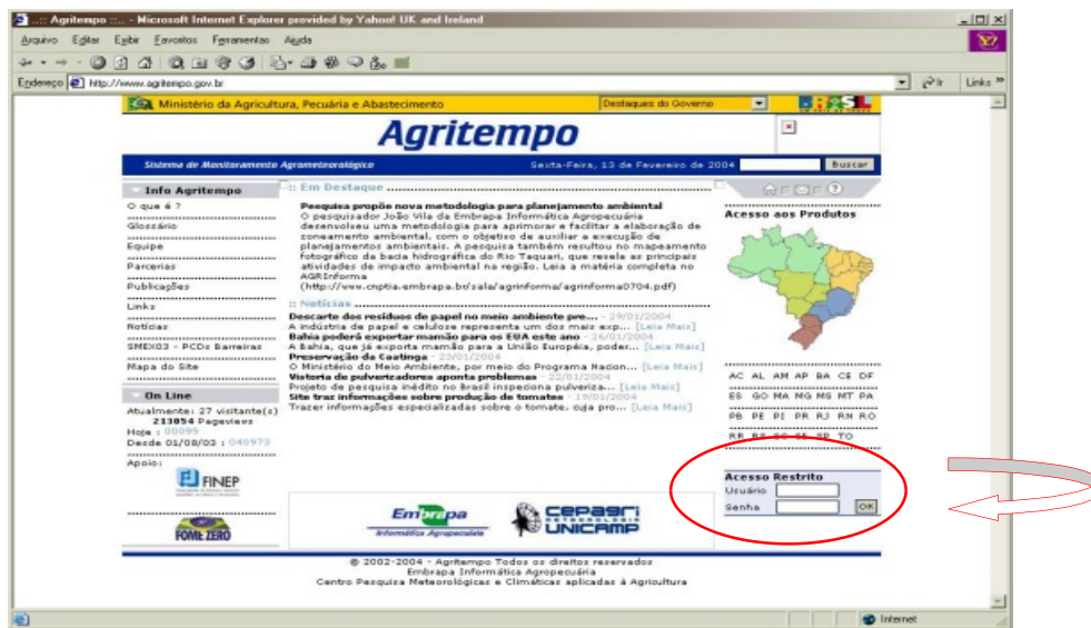
Fig 1. Acesso por senha na página inicial do Agritempo.

Todos esses dados são extraídos do banco do sistema Agritempo por meio de uma interface construída em Java Server Pages (Sun Microsystems, 2003), com acesso por senha intermediado pela página inicial do Agritempo (Fig. 1). O usuário informa a localização, áreas plantadas, período do plantio, vazão das motobombas e eficiência de irrigação (Fig. 2), que constituem dados-base para o cálculo e consultas ao banco de dados do Agritempo.