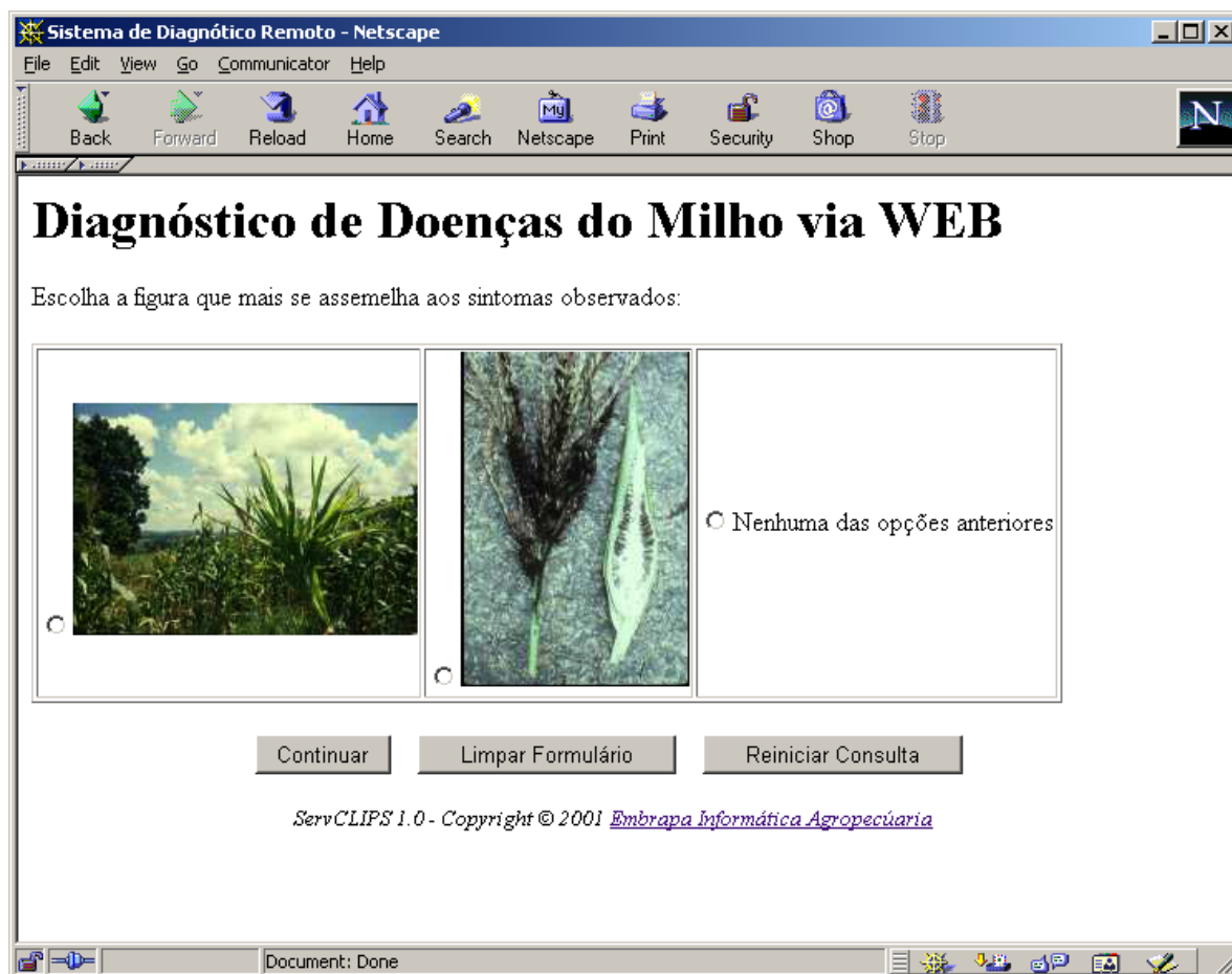
Fig. 3. Apresentação da questão CLIPS para o usuário.

A apresentação da questão ao usuário no navegador WWW é mostrada na Fig. 3.