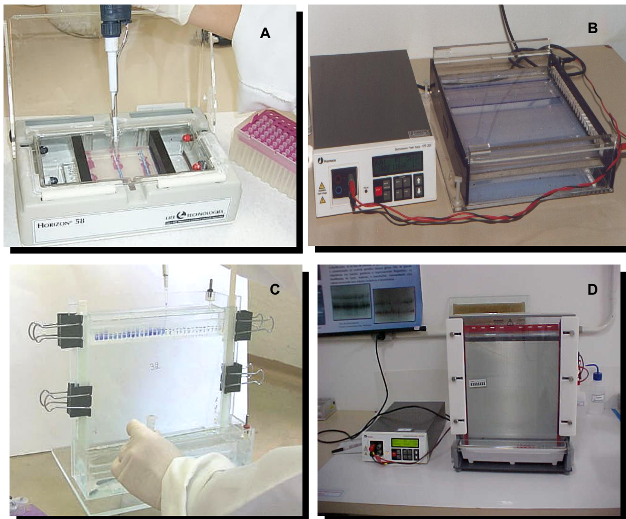
Fig. 3. Sistemas de eletroforese quanto à migração das amostras: A e B –horizontal, C e D – vertical.