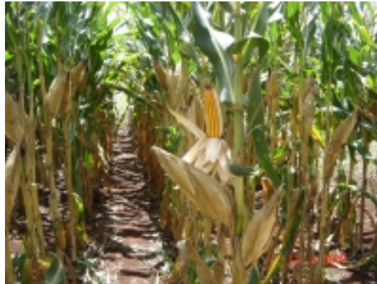
Passo Fundo, RS 2007