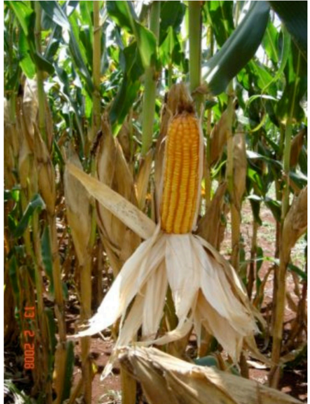
Figura 4. Híbrido de milho BRS 1002: capacidade de manter suas folhas verdes até próximo da maturação fisiológica ( stay green ).