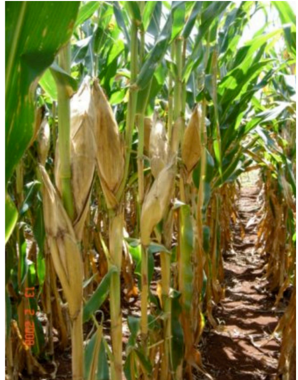
Figura 3. Híbrido de milho BRS 1002: porte médio e folhas eretas.