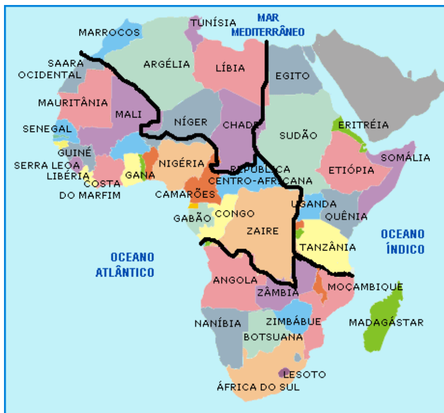
Figura 2. Continente africano dividido por regiões de origem dos acessos de germoplasma de milheto

A maioria dos acessos que compõem o BAG foi introduzida no Brasil por doações do Icrisat, localizado no Sul da Índia. Neste local, foi verificada a origem de 70% dos acessos. Apesar do centro primário de diversidade genética de milheto ser a zona Semi-Árida Saheliana da África, entre o Oeste do Sudão e o Senegal, importantes centros secundários de diversidade genética são encontrados no subcontinente indiano e no Leste e no Sul da África (Grains, 1996). Os Estados Unidos contribuíram com 4% dos acessos armazenados no BAG, sendo que foram dados pela