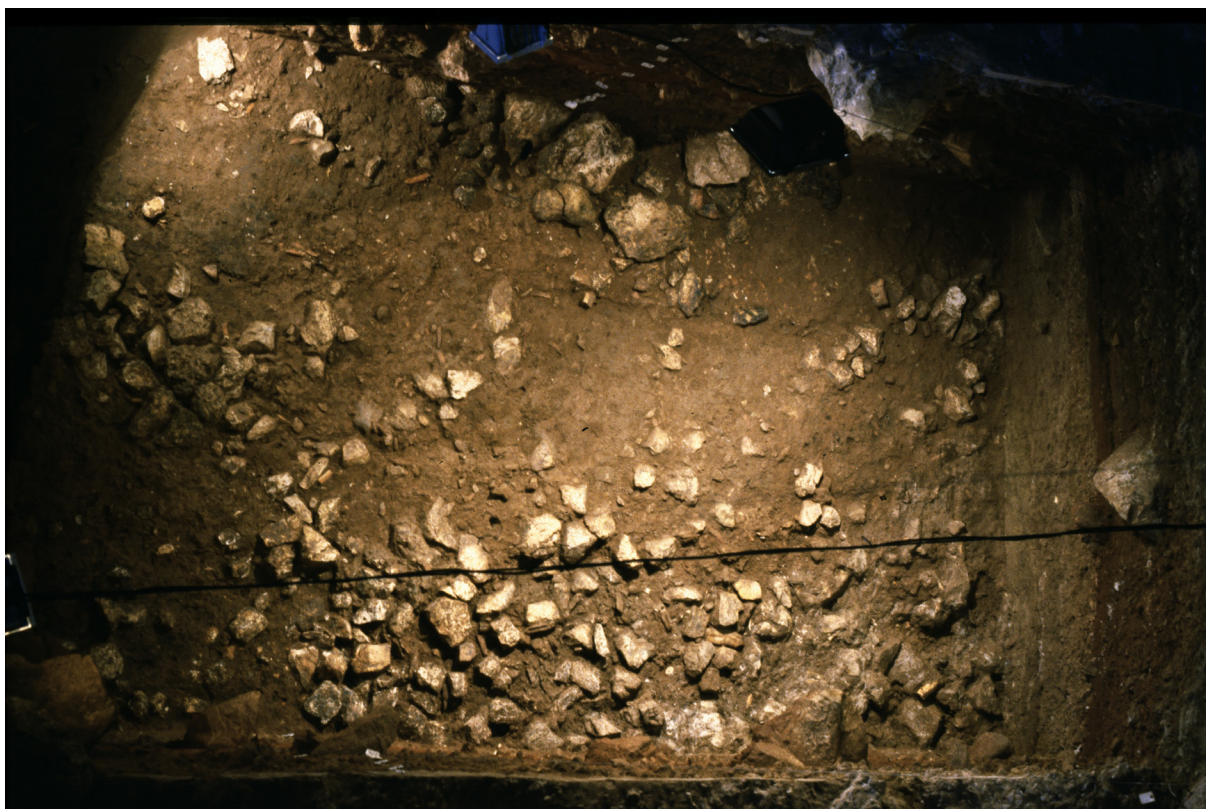
Figura 1. Grotta del Cavallo – Strato M: un'immagine della paleosuperficie 2A.