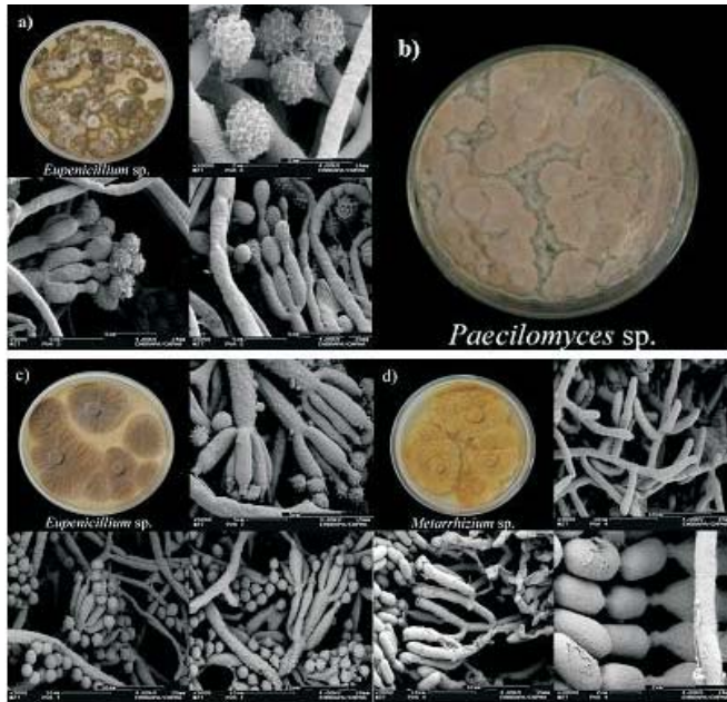
Fig. 3. Fungos isolados em solo Podzólico vermelho-amarelo (AVA) suplementado com sulfentrazona, aos 4 (a) e 7 (b, c, d) dias de crescimento, em meio Ágar Sabouraud. A foto mostra a ultraestrutura de conídios, fiáldes e conidióforos dos fungos identificados Eupenicillium sp., Paecilomyces sp e Metarrhizium sp. A imagem foi obtida por microscopia eletrônica de varredura com emissão de campo (Leo 928).

Também tem sido foco de estudo, a influência dos herbicidas sobre grupos bacterianos com importante função no ciclo do nitrogênio do solo, no entanto, os resultados demonstraram pouca influência destes compostos sobre a amonificação ou sobre a nitrificação do solo (VIEIRA et al., 2007; DAS & MUKHERJEE, 1998; OLSON & LINDWALL, 1991). No presente estudo a bactéria Rhizobium radiobacter , no solo LVA, não foi afetada pelo herbicida sulfentrazona, crescendo em dose 10 vezes maior do que a dose de campo ( 7,0 \mu\text{g g}^{-1} solo).