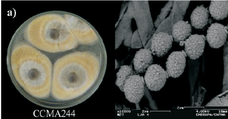
Fig. 1. Linhagem fúngica, não identificada, isolada em latossolo vermelho-amarelo (LVA) suplementado com sulfentrazona, aos 10 dias de crescimento, em meio Ágar Sabouraud. A foto mostra a ultraestrutura de conídios do fungo. A imagem foi obtida por microscopia eletrônica de varredura com emissão de campo (Leo 928).